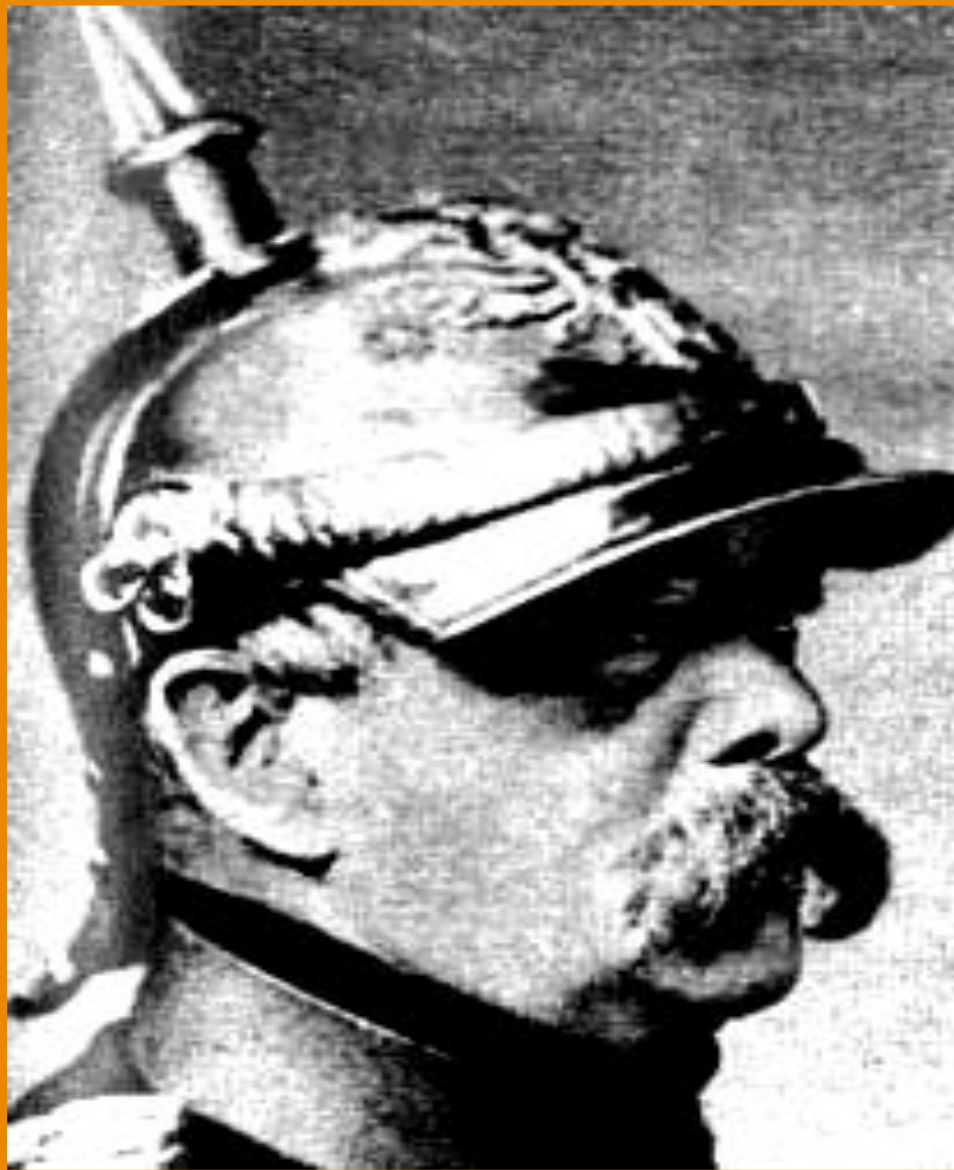
Отто Фон Бисмарк

В союзе с Россией в н.80-х гг. были заинтересованы Германия и Франция.