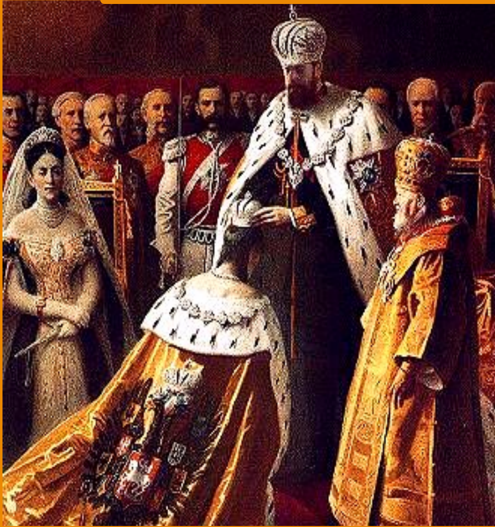
Коронация Александра III.

Александр III взял руководство внешней политикой в собственные руки. Ему помогал министр иностранных дел Н. Гирс. Важнейшие посты в министерстве сохранили дипломаты горчаковской школы.