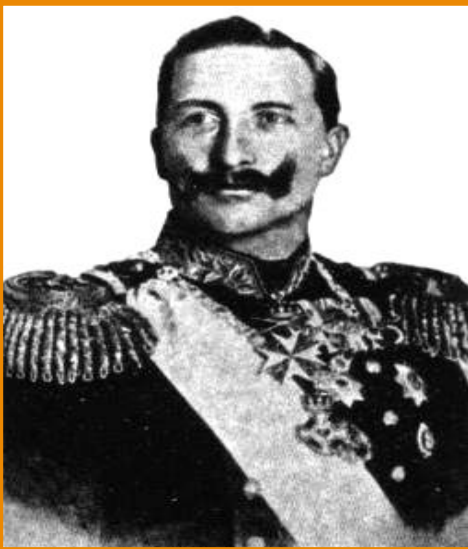
Германский император. Вильгельм I.

В 1887 г. отношения Германии и Франции обострились и лишь вмешательство Александра III, предотвратило войну. В ответ Германия начала таможенную войну.