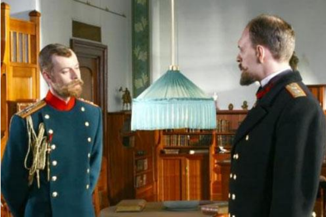
П.А. Столыпин и Николай II