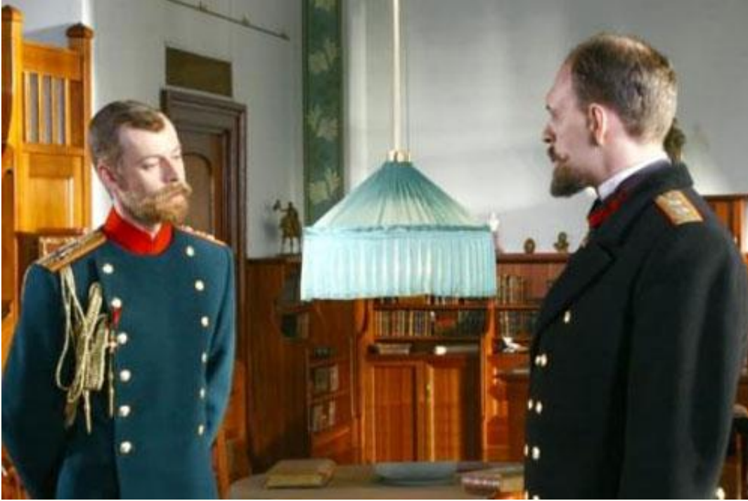
П.А. Столыпин и Николай II