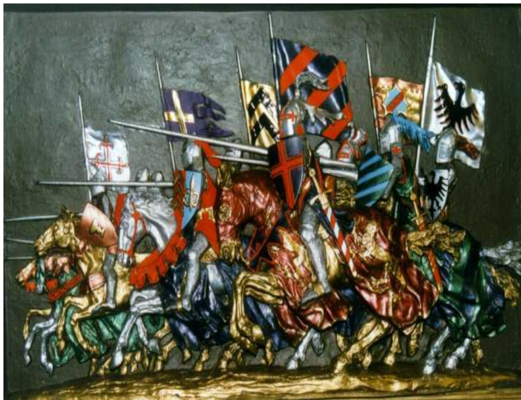
Атака французских рыцарей