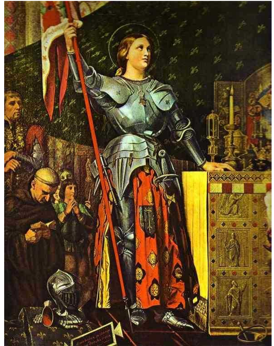
Жанна д'Арк на коронации Карла VII