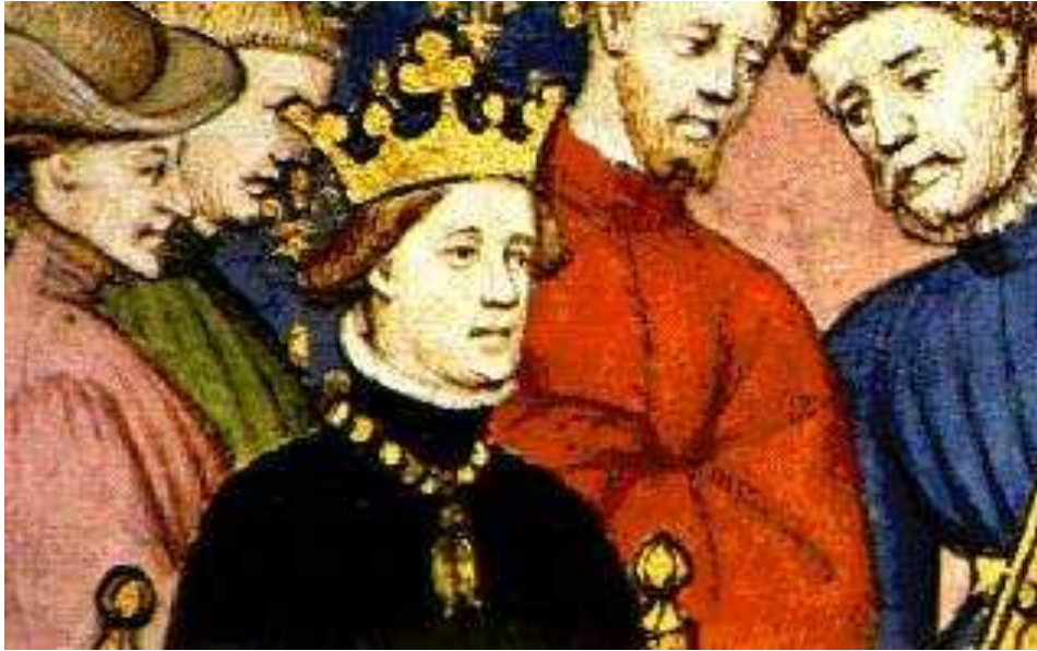
Карл VI Безумный – французский король. 1380-1420 гг.