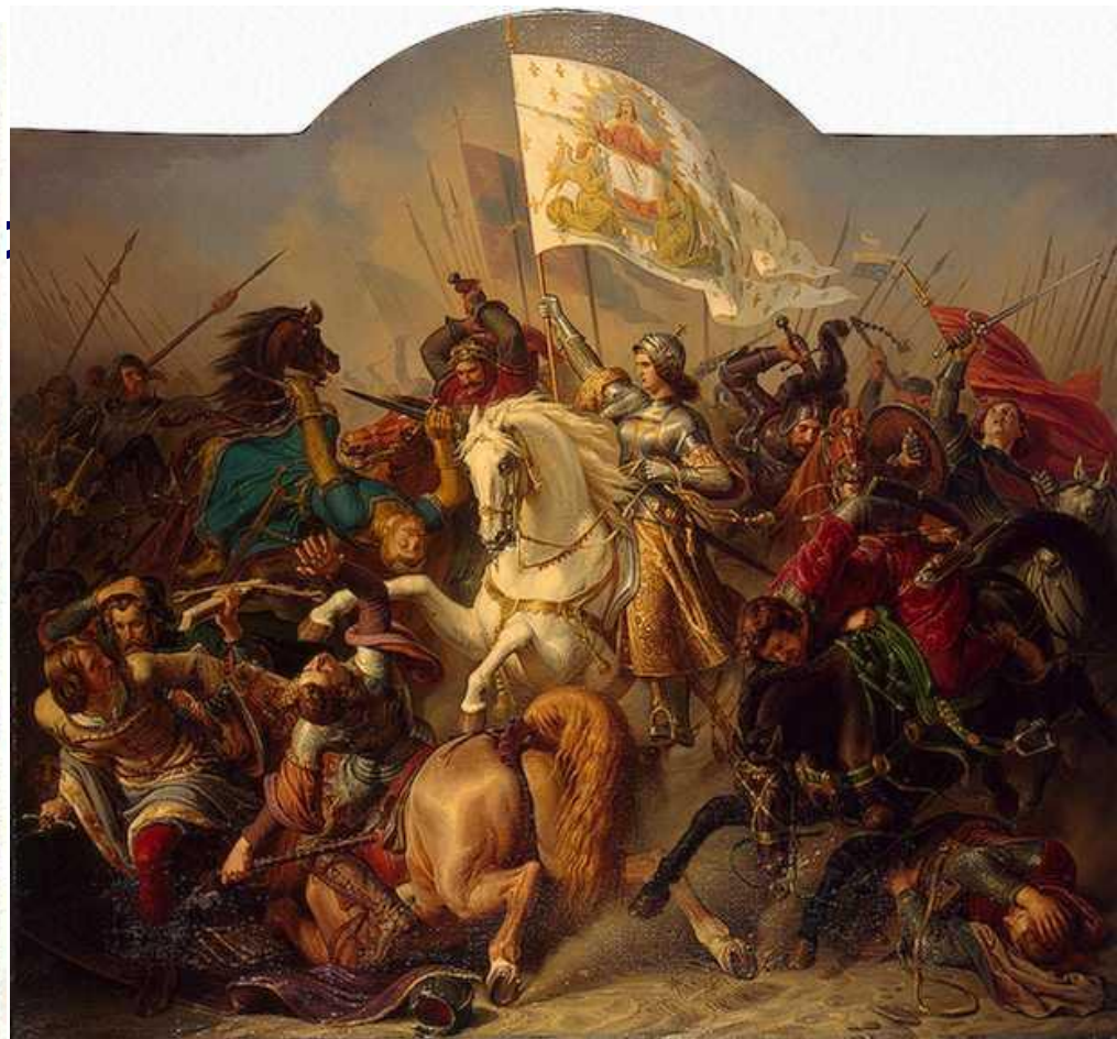
Жанна д'Арк в бою