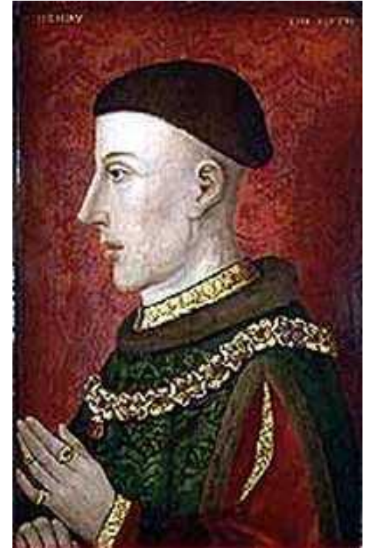
Генрих V- английский король 1413-1422 гг.