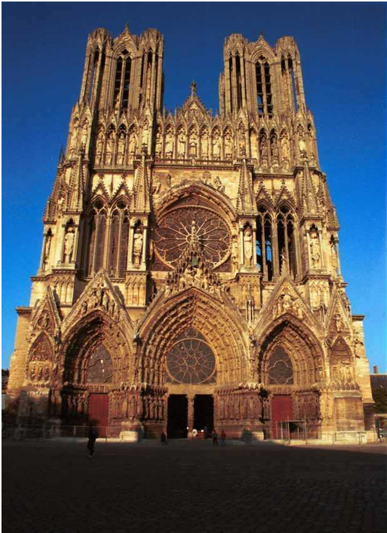
Собор в Реймсе