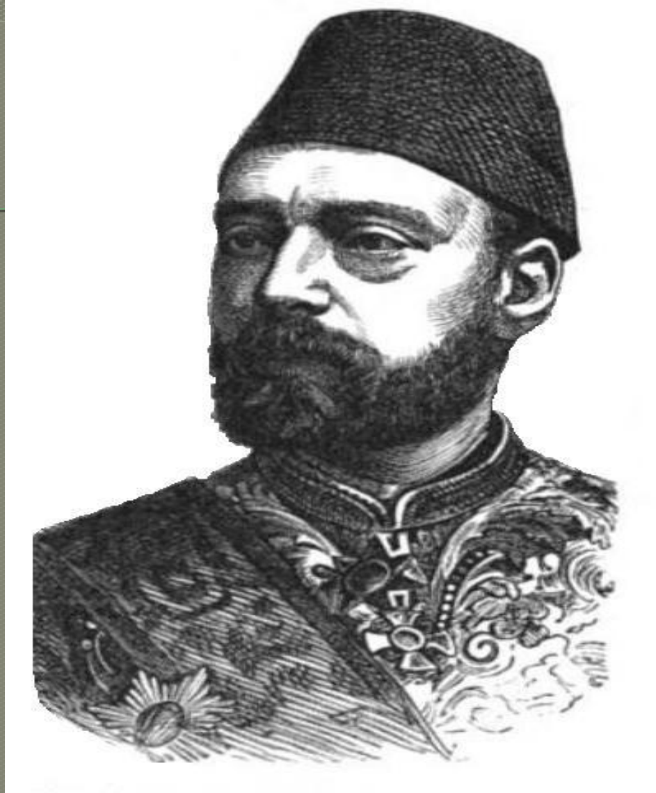
Айдозли Мехмет-паша (комендант крепости Измаил)