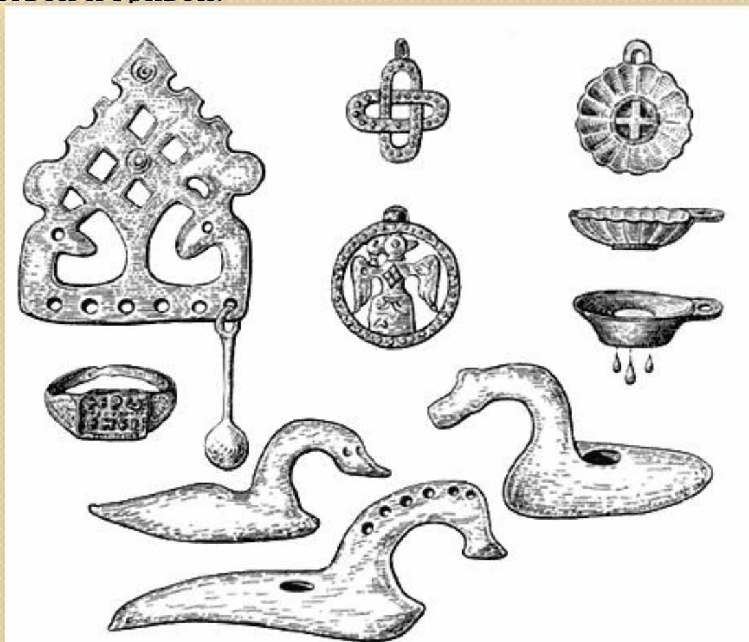
Рис. 91. УКРАШЕНИЯ С ЯЗЫЧЕСКИМИ СИМВОЛАМИ.

Большое количество архаизмов в прикладном искусстве сохранилось в глухой лесной земле радимичей, где почти не было городов. Здесь в курганах находят своеобразные костяные подвески в виде уточек с конской головой и гривой.