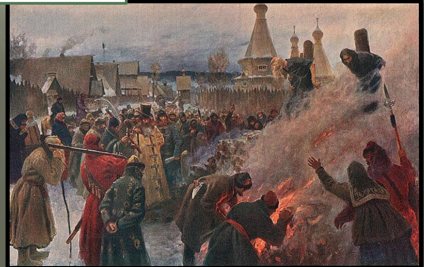
И. Мясоедов «Сожжение протопопа Аввакума»