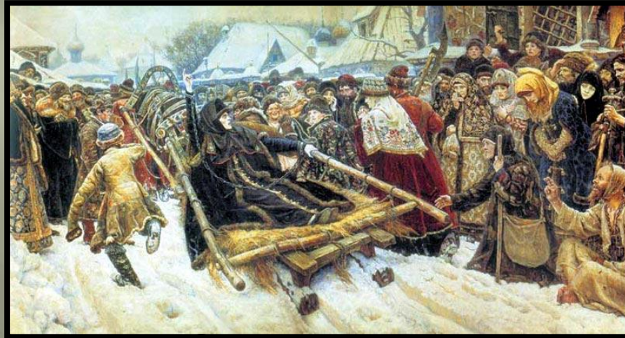
В.И. Суриков «Боярыня Морозова»