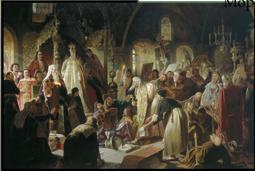
В.Г. Перов «Спор о вере»