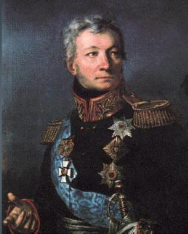
Генерал А.П. Тормасов