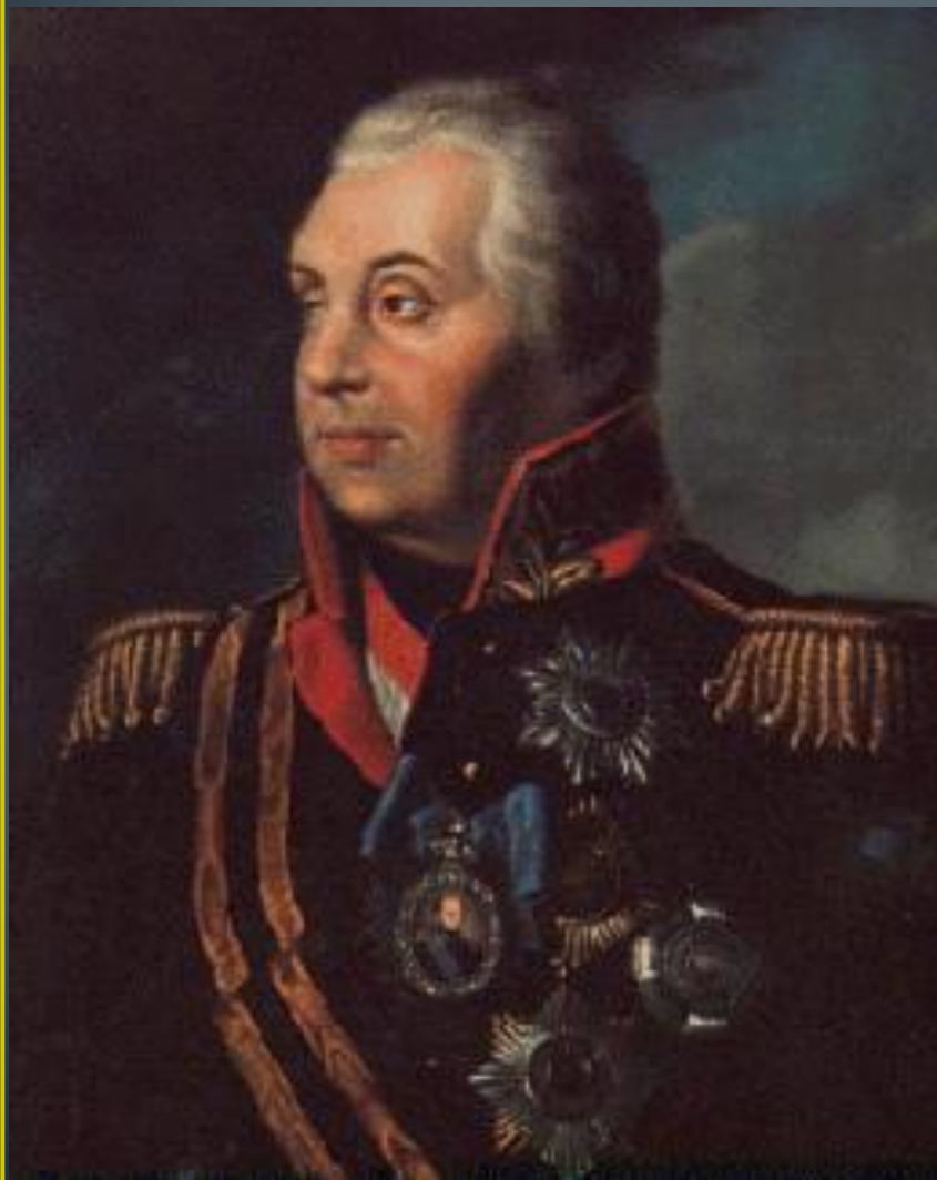
Михаил Илларионович Кутузов (1745 – 1813)