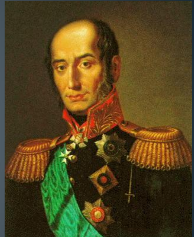
Генерал М.Б. Барклай-де-Толли