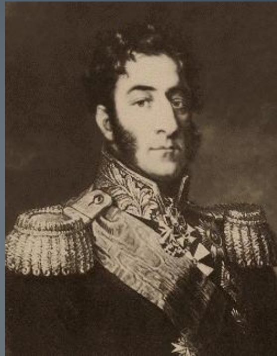
Генерал П.И. Багратион