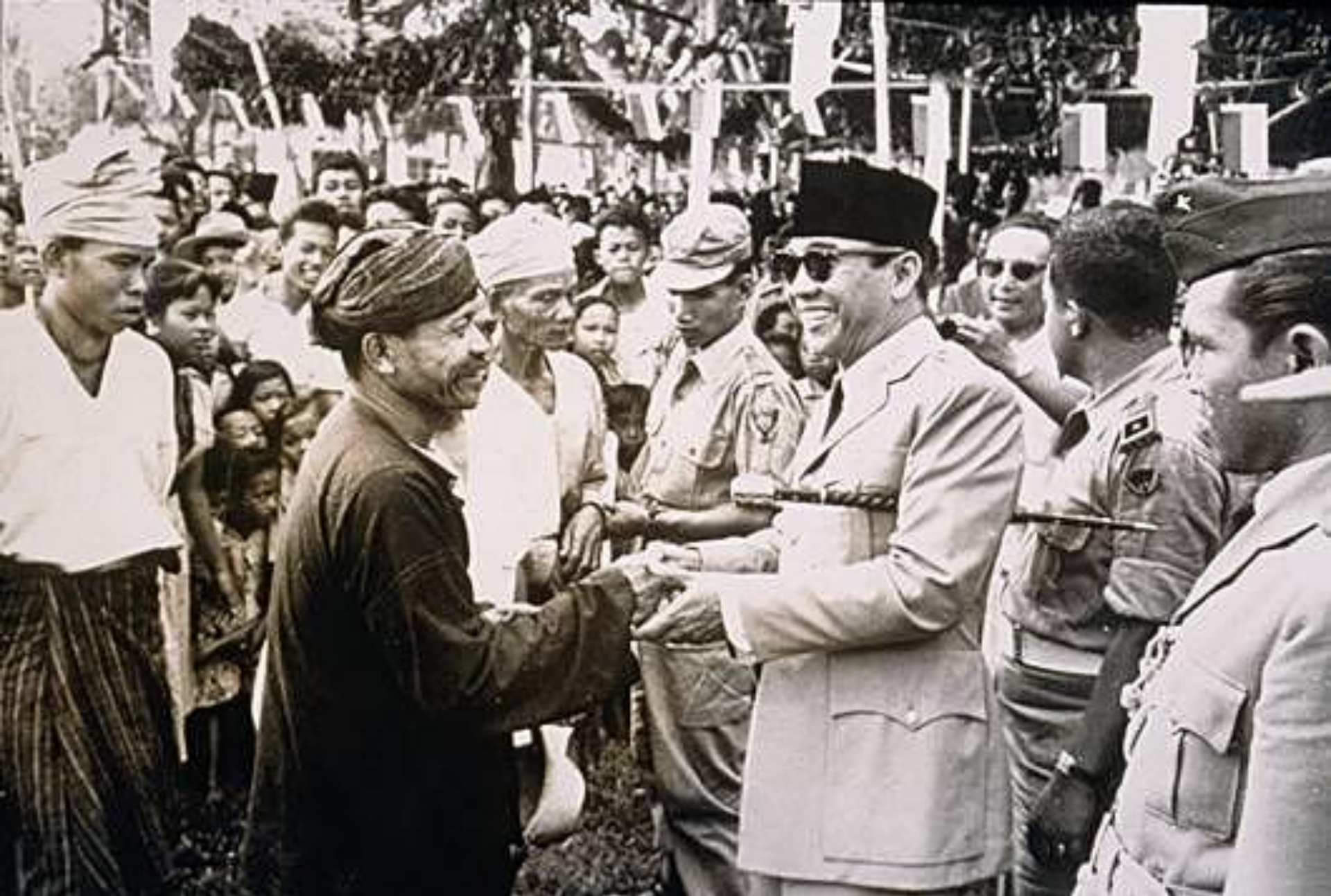
Сукарно (1901–1970 гг., Индонезия)