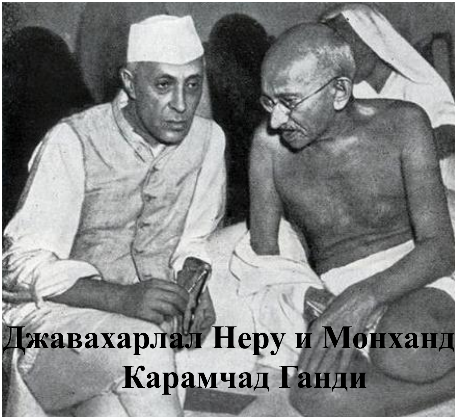
Джавахарлал Неру и Монхандас Карамчад Ганди