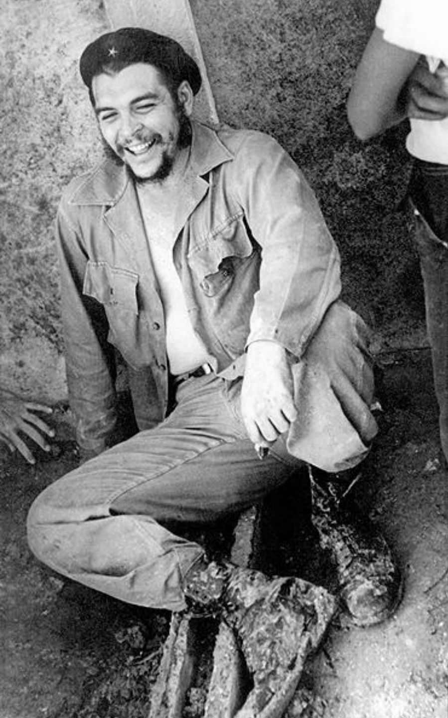
Эрнесто Че Гевара (1928–1967 гг. Аргентина – Боливия)