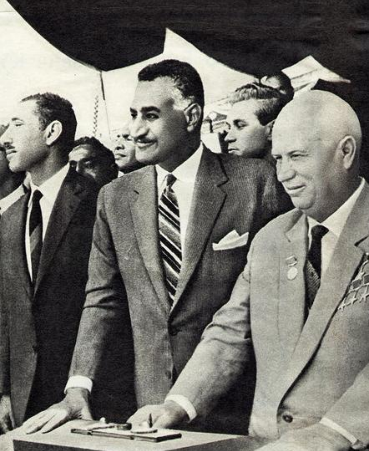
Гамаль Абдель Насер и Никита Сергеевич Хрущёв