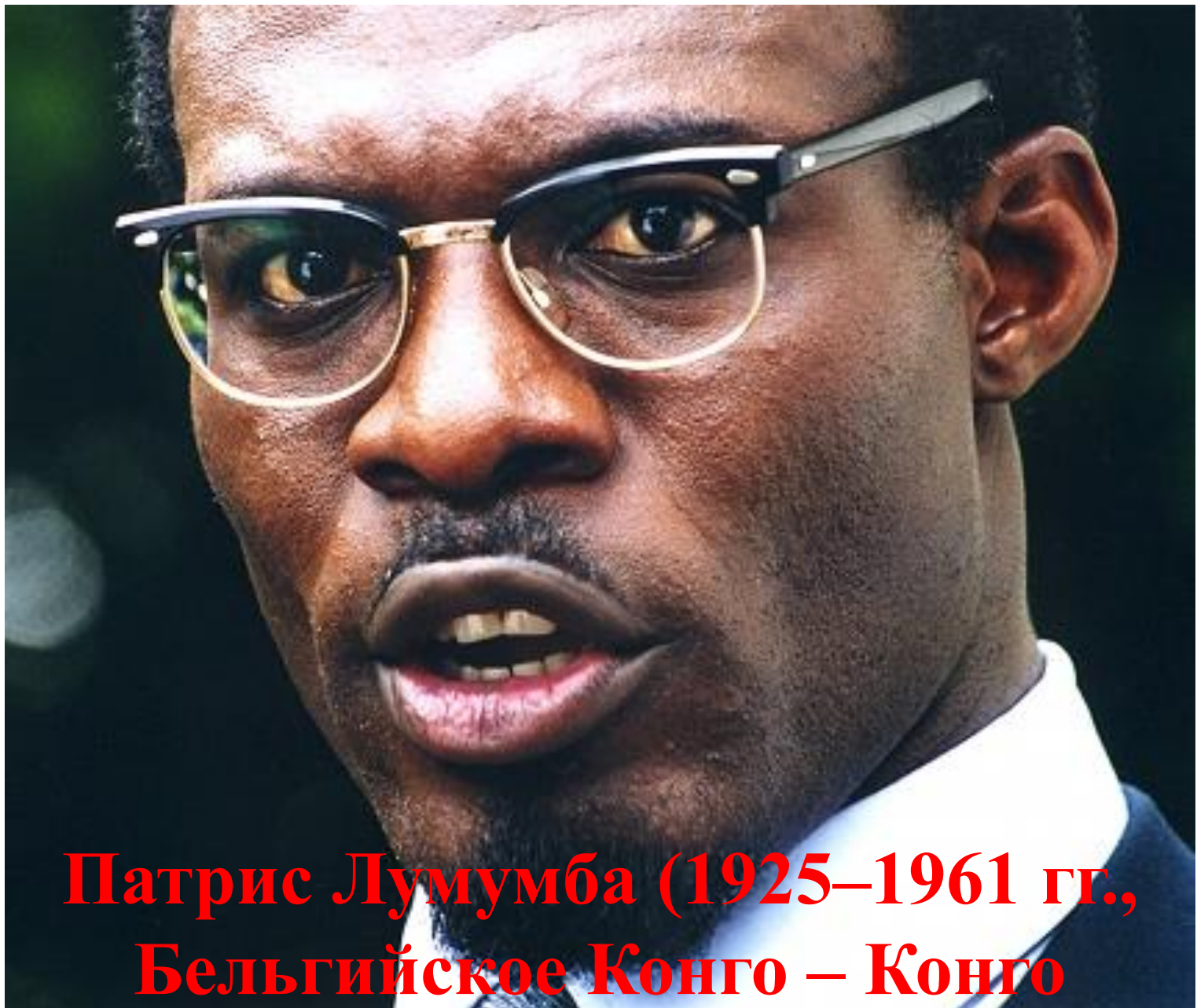
Патрис Лумумба (1925–1961 гг., Бельгийское Конго – Конго (Киншаса))