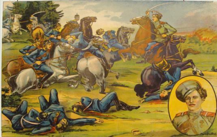
Геройскіи подвигъ донскаго казака Козьмы Крючкова.

Первым из солдат русской императорской армии за храбрость получил Георгиевский крест четвертой степени. Казачий сторожевой дозор из троих рядовых во главе с приказным Крючковым, обнаружив отряд немецких кавалеристов из 27 человек и начал его преследование. Козьма в бою был окружен немцами и отбивался винтовкой и шашкой, а после, вырвав из рук немецкого драгуна пику, заставив ею разорвать кольцо окружения, сумел уйти из рук неприятеля, оставив на поле боя 11 группов противника , в том числе и, убитого им, командира немецкого отряда. Крючков получил 16 колотых ран сам и 11 ран досталось его лошади «Костяк» , товарищи тоже не подкачали — в общем, к исходу схватки были убиты и гяжело ранены двадцать четыре немецких кавалериста из 27. Казаки за этот бой были награждены, все стали Георгиевскими кавалерами.