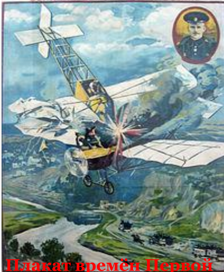
Плакат времён Первой мировой войны «Подвиг и гибель лётчика Нестерова»

Нестеров смело пошел ему наперерез в легком быстроходном самолете "Моране". Австриец пытался убежать, но Нестеров настиг его и врезал свой самолет в хвост австрийского самолета-разведчика . Оба самолета рухнули на землю, оба летчика погибли .