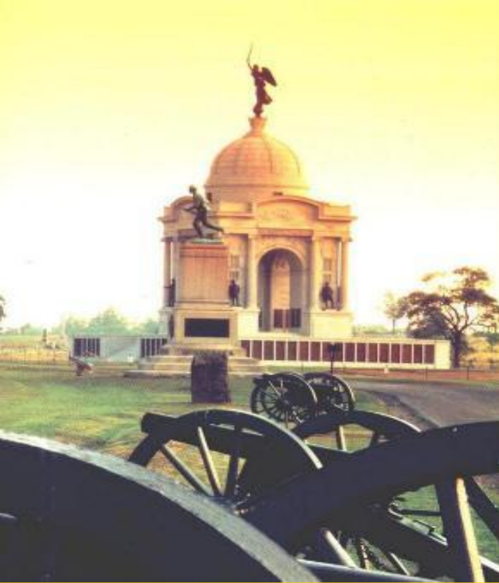
Мемориал при Геттисберге

В армию северян хлынули добровольцы-негры и белые.