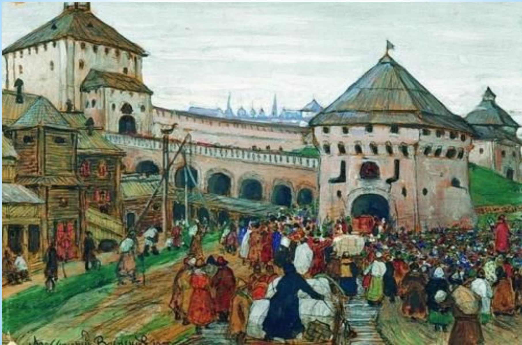
Васнецов А. Древний город Москва. XVI век.