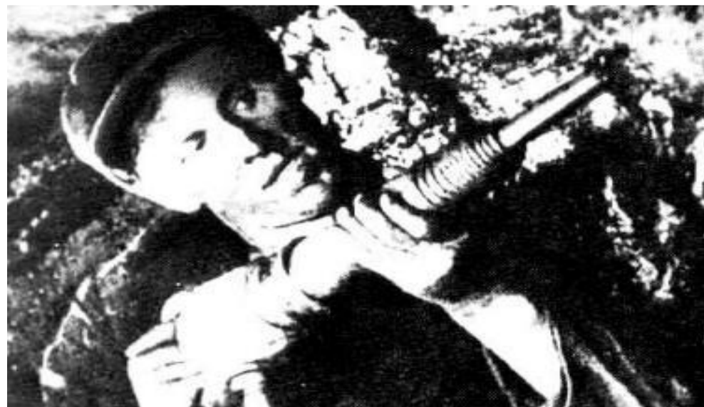
А. Стаханов. в шахте

2 пятилетка не привела к повышению уровня жизни населения. Отменялись карточки на продовольствие, но общий уровень цен повысился. Рабочие вынуждены были подписываться на государственные займы. Жилищные условия не улучшались, т.к. число жителей в городах росло.