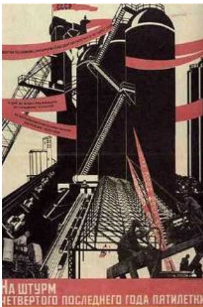
Н.Доглоруков. Пропагандистский плакат.

В 1932 г.объявив об успехе 1-й пятилетки,Сталин за метил,что теперь нет необходимости «подхлестывать страну» и 2-й пятилетний план предусматривал снижение темпов прироста промышленной продукции с 30 до 16 %,при этом рост легкой промышленности должен был быть выше , чем рост тяжелой. План предусматривал создание опорных промышленных баз на Урале, в Сибири, Средней Азии.