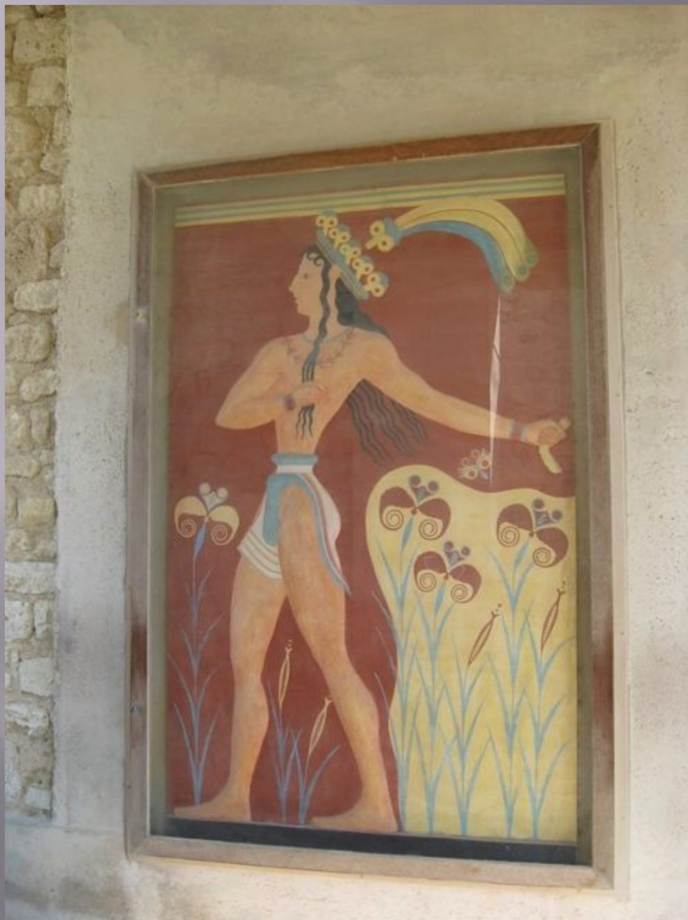
Юноша. Фреска на стене дворца.