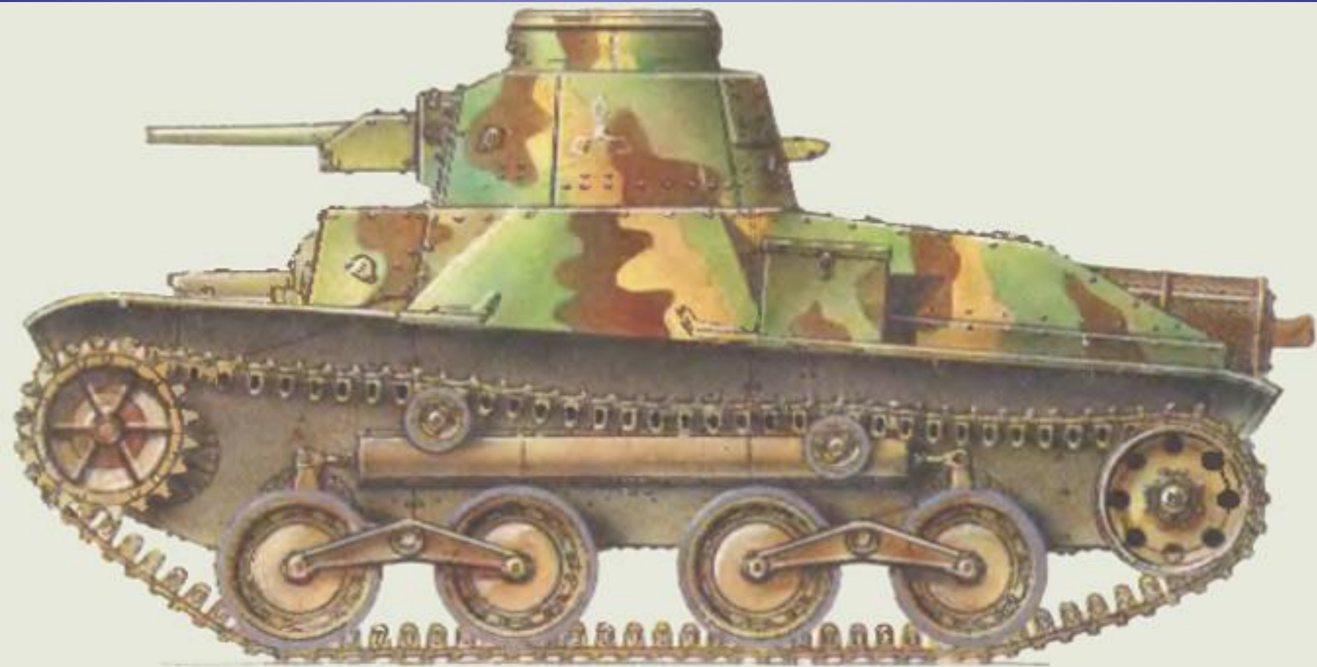
Японский танк Ха-Го