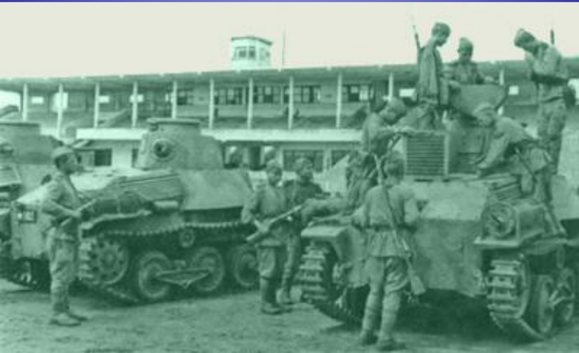
Танки Ха-Го, захваченные нашими войсками