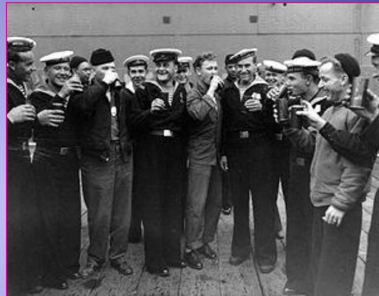
Советские и американские моряки празднуют капитуляцию Японии