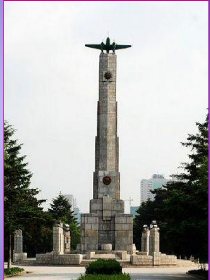
Памятник советским воинам в Чанчуне