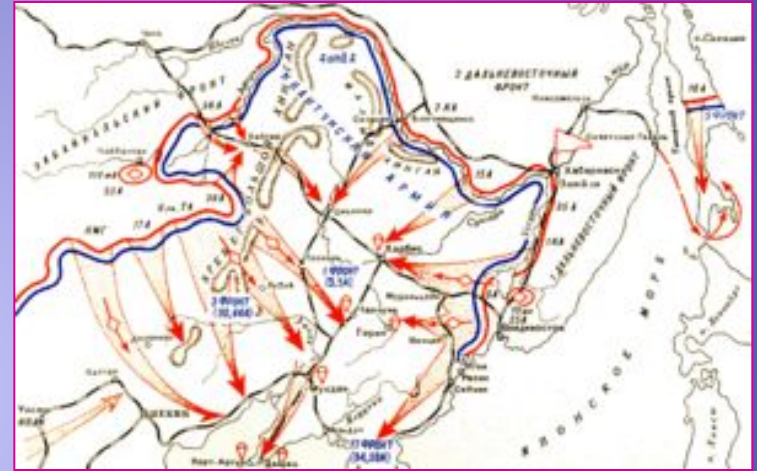
Схема боевых действий