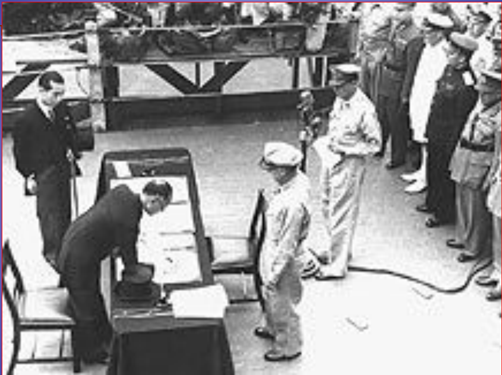
Подписание акта о безоговорочной капитуляции Японии в 1945 г.