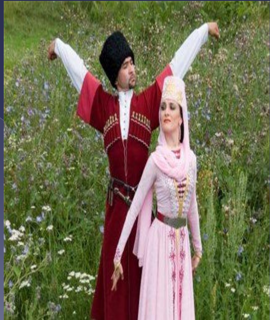
Народный костюм ингушей