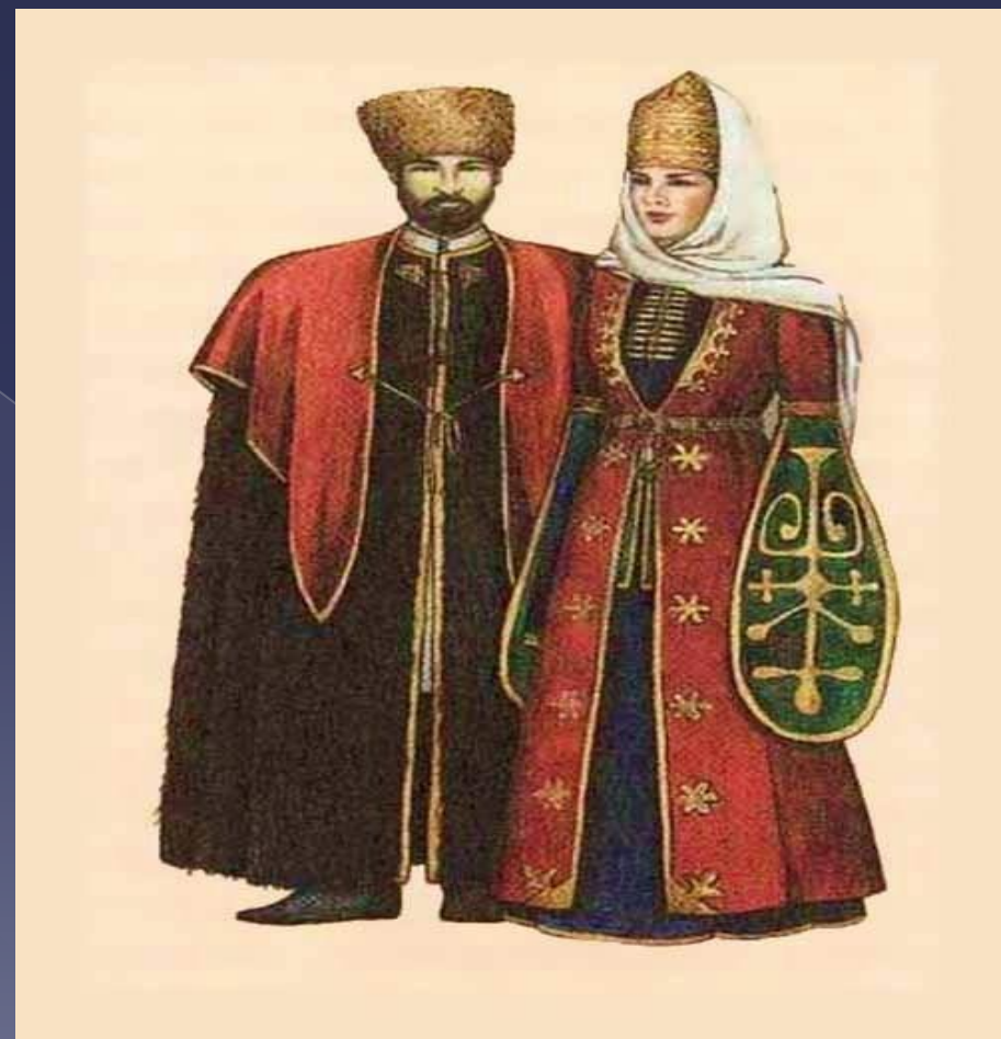
Народный костюм адыгов