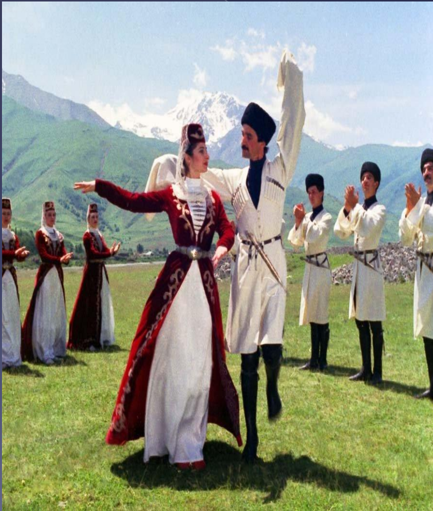
Лезгинка – национальный танец

Ингуши — вайнахский народ на Северном Кавказе. Говорят на ингушском языке нахской группы северокавказской семьи, письменность на основе кириллицы.