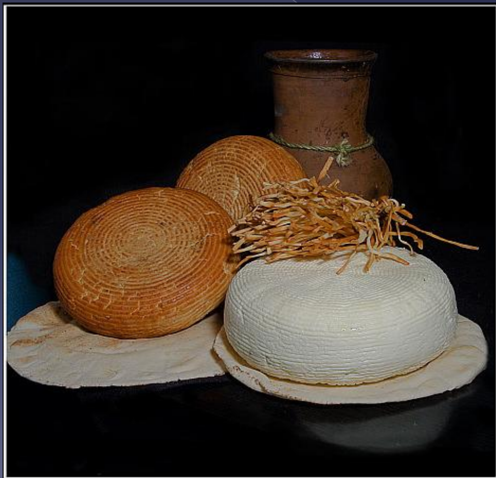
Адыгейский сыр – национальное блюдо

АДЫГИ - этническая общность, включающая адыгейцев, кабардинцев, черкесов. Численность в России 559,7 тыс. чел.: адыгейцы - 122,9 тыс. чел., кабардинцы - 386,1 тыс. чел., черкесы - 50,8 тыс. чел.