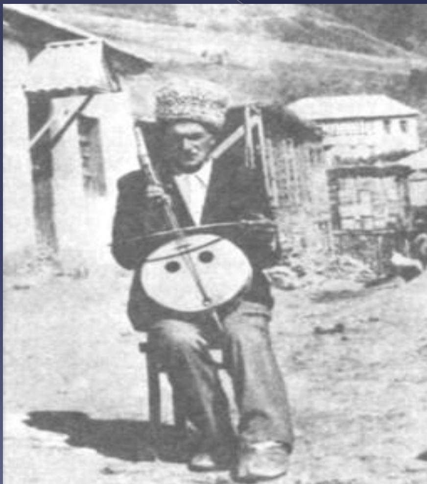
Национальный инструмент - чагана

Аварцы — самый многочисленный народ современного Дагестана