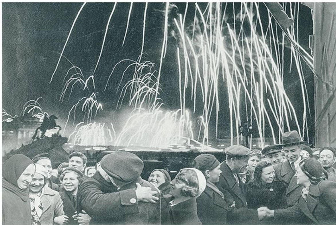
«Великая победа одержана советскими войсками под Ленинградом:»

18 января 1943 года, со взятием советскими войсками Шлиссельбурга Ленинградская блокада была прорвана. По южному побережью Ладожского озера была проложена железная дорога до станции Поляны, названная впоследствии Дорогой Победы. Блокада Ленинграда длилась 871 день.