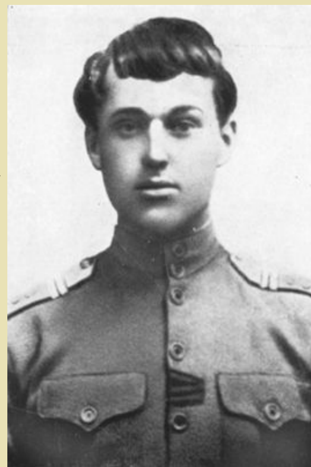
Унтер-офицер К. К. Рокоссовский

«С самого раннего детства, меня увлекали книги о войне, военных походах, битвах, смелых кавалерийских атаках... Моей мечтой было испытать все, о чем говорилось в книгах, самому». К. К. Рокоссовский