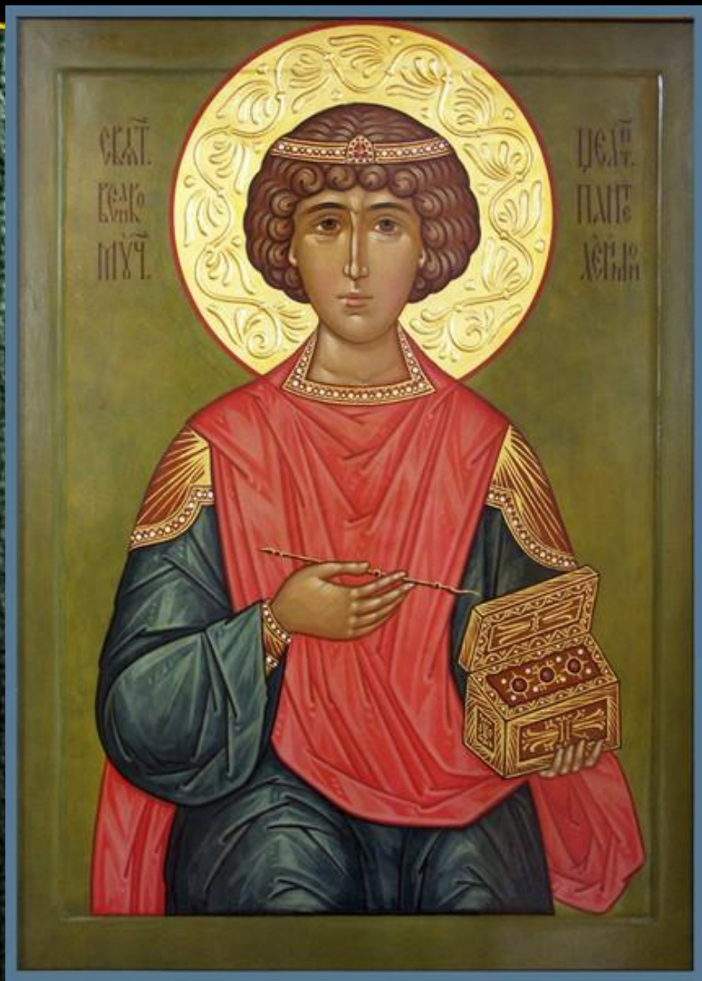
Икона. Святой Пантелеймон