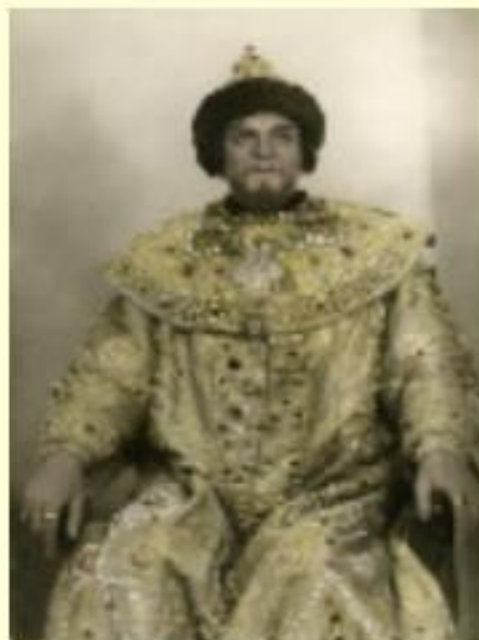
Шапка Мономаха – царский венец