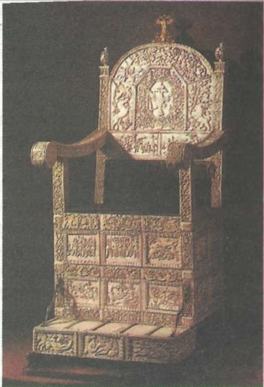
Царский трон Ивана IV.