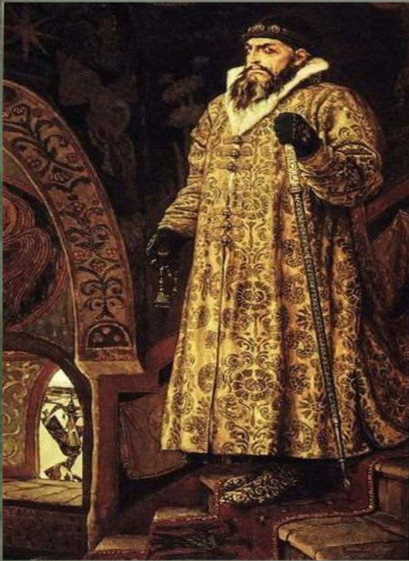
В. М. Васнецов Царь Иван Грозный