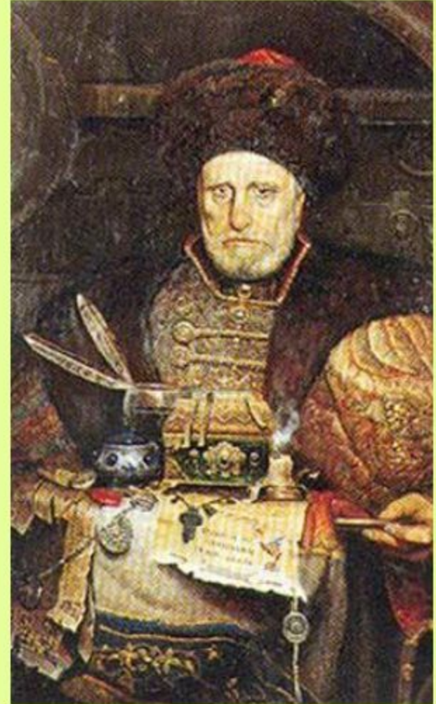
Князь А. Курбский