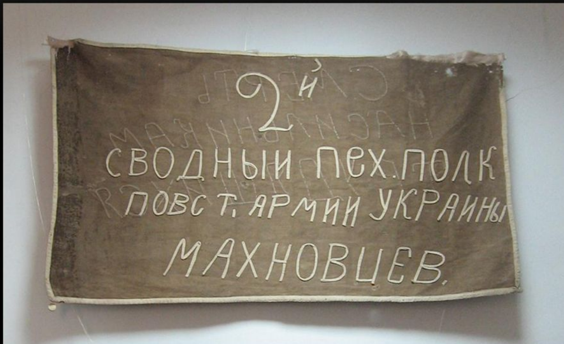
Флаг 2-го сводного полка махновцев