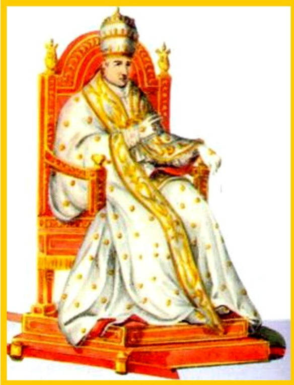
Папа Пий IX

Восставшие надеялись на либерального Папу Пия IX. Папа объявил Конституцию и революция распространилась по всей Италии. Австрийцы начали отступать из-за разразившейся в стране революции.