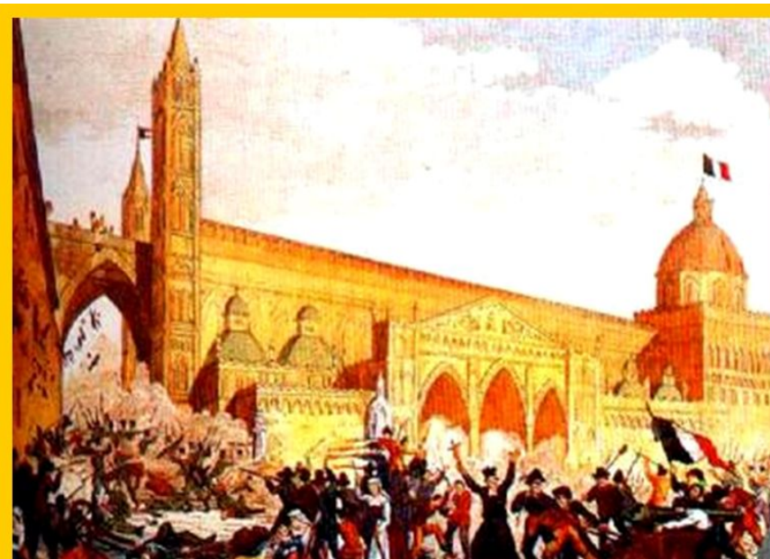
Восстание в Палермо.

Революция охватила и Папскую область, которой восставшие придавали особое значение, как сердцу страны.