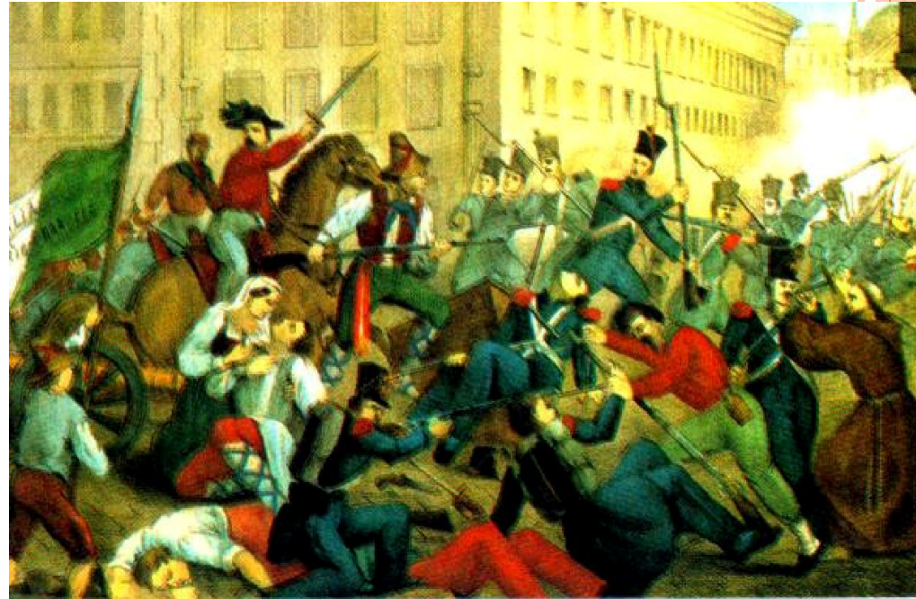
Вступление Гарибальди в Палермо.

□ Освободив остров, они переправились в Италию и 7 сентября вступили в Неаполь. В октябре королевские войска были разбиты.