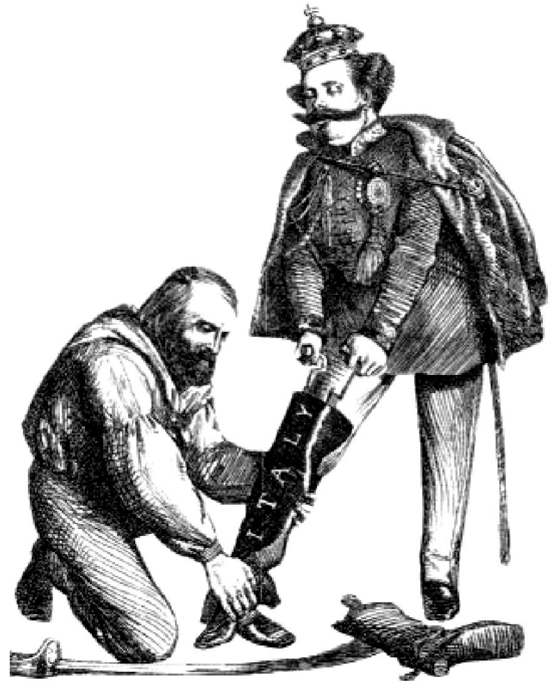
Виктор-Эммануил III Примеряет «Итальянский сапожок»

Австрия потерпела ряд поражений. Победа была близка, но Наполеон III неожиданно заключил с Австрией перемирие. Это не остановило нового подъема освободительного движения. Вновь восстали Тоскана, Папская область, Модена, Парма и объявили о присоединении к Сардинскому королевству.