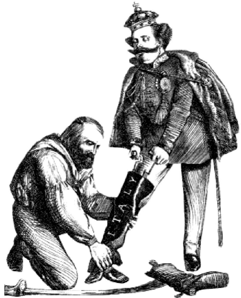
Виктор-Эммануил III Примеряет «Итальянский сапожок»

Австрия потерпела ряд поражений. Победа была близка, но Наполеон III неожиданно заключил с Австрией перемирие. Это не остановило нового подъема освободительного движения. Вновь восстали Тоскана, Папская область, Модена, Парма и объявили о присоединении к Сардинскому королевству.