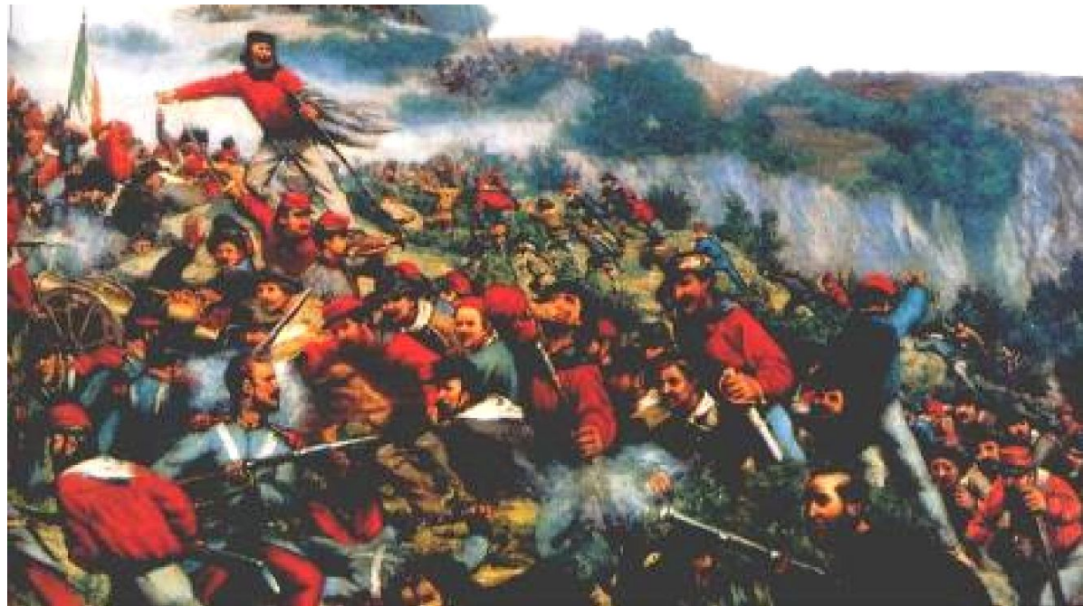
«Тысяча» в бою