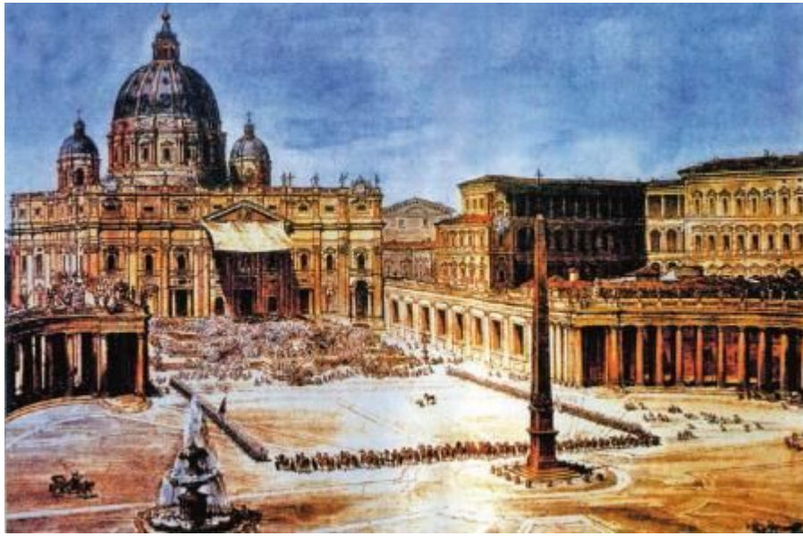
Папское благословение на площади Св. Петра в Риме

Волнения перекинулись на Рим и Флоренцию, где в феврале 1849г. была провозглашена республика. Из Венеции были изгнаны австрийцев, установлена Республика!