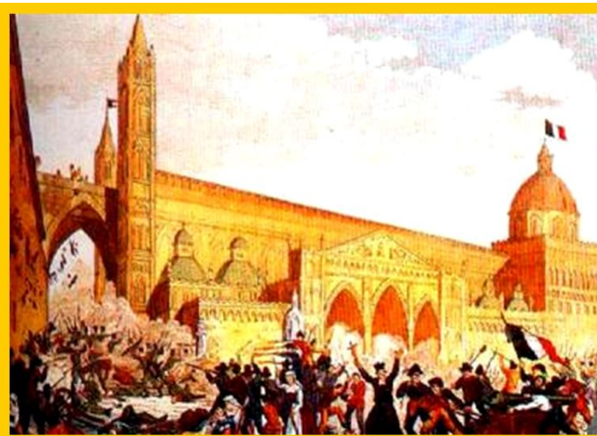
Восстание в Палермо.

Революция охватила и Папскую область, которой восставшие придавали особое значение, как сердцу страны.