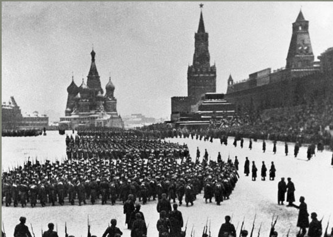
Парад в Москве . 1941 год.