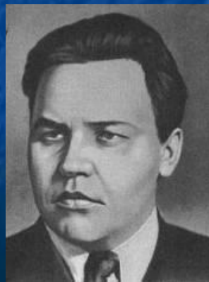
А.А. Жданов Н.А. Вознесенский