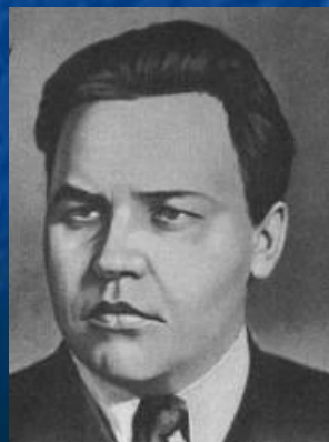
А.А. Жданов Н.А. Вознесенский