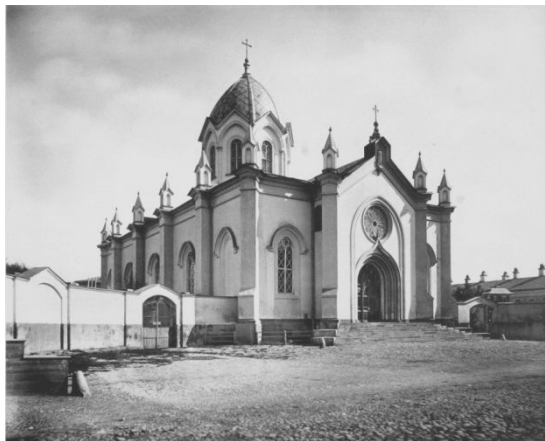
католический храм Св. А постолов Петра и Павла. 1706 г.

1715г. Помещикам мусульманам Запрещено владеть православными крестьянами.