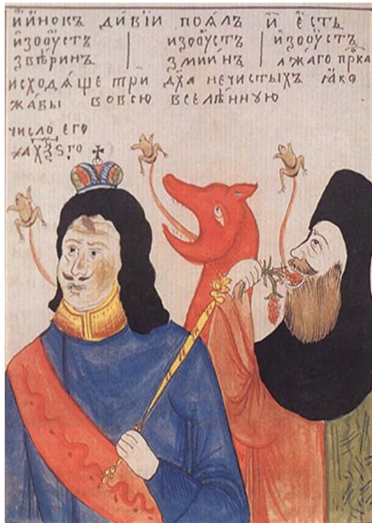
Петр Первый как Антихрист в представлении неизвестного