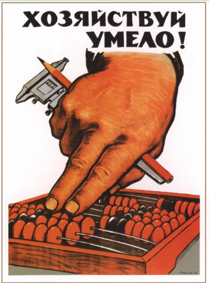
Хозяйствуй умело! 1966