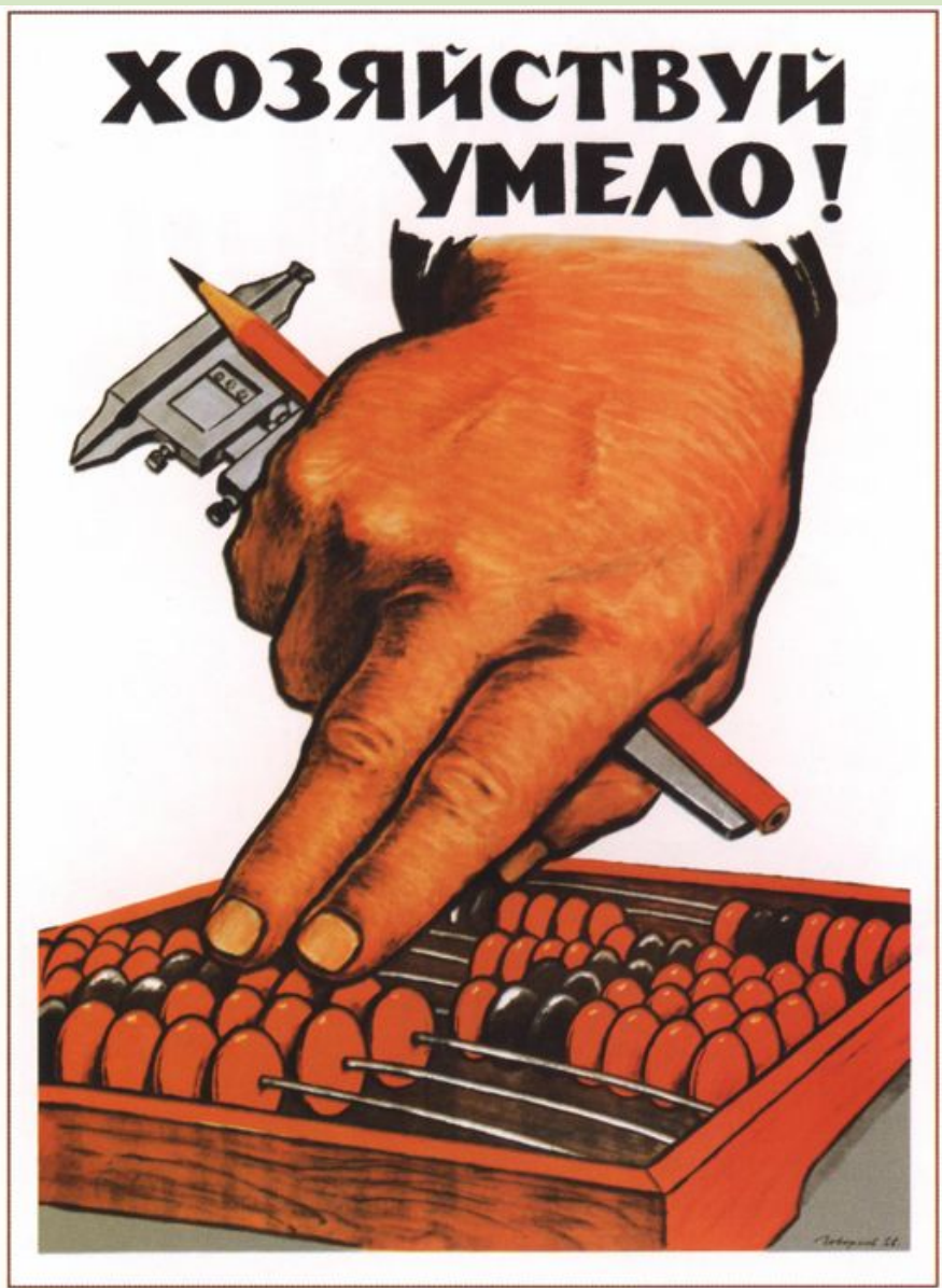
Хозяйствуй умело! 1966