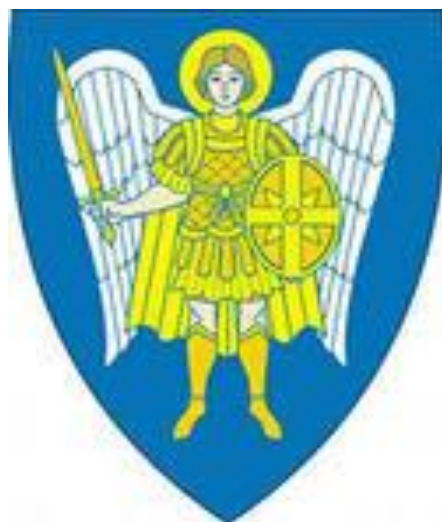
Герб киевского княжества