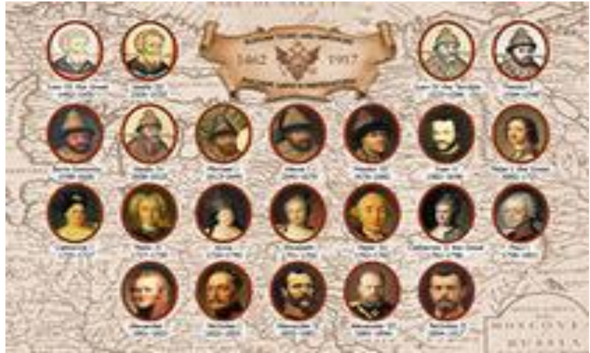
Генеалогическое древо Рюриковичей и Романовых