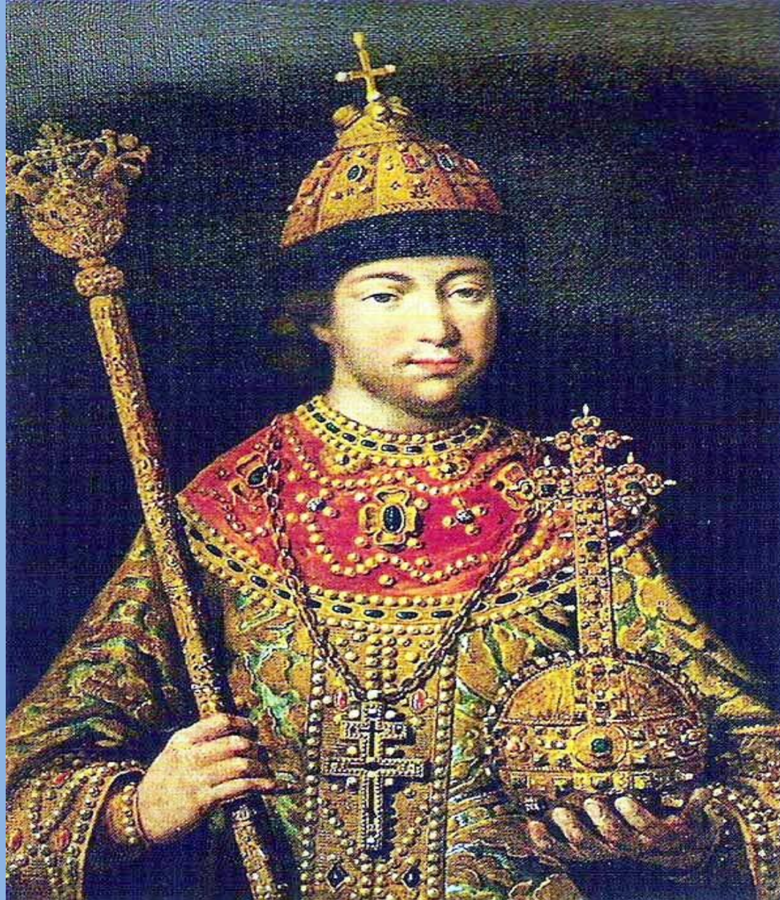
Молодой царь Михаил.