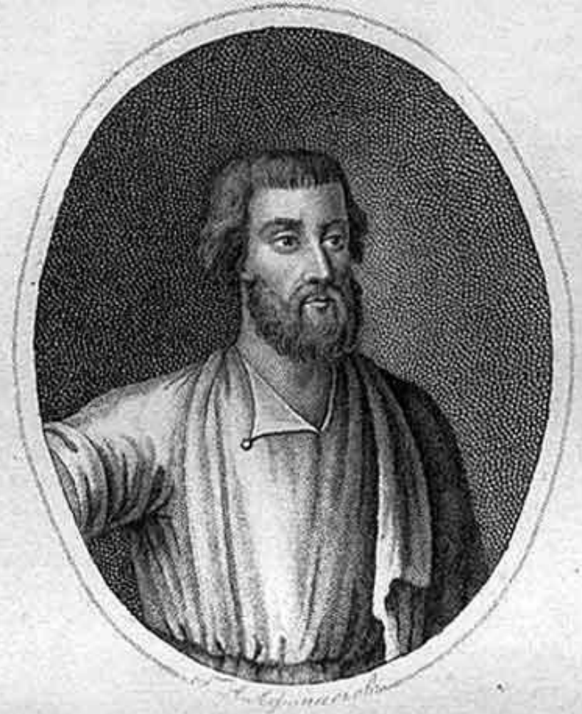
Кузьма Мининъ, Гражданинъ Нижегородскій, потомъ Думный Дворянинъ.

Влияние Минина росло с каждым днем. Нижегородцы с вниманием слушали предложения Минина и наконец решили образовать ополчение, созвать служилых людей и собрать деньги. Снабженное всем необходимым народное ополчение 22-26 октября 1612 года освободило от интервентов Москву. Минин участвовал в Земском соборе 1613 года, был провозглашен думным дворянином, пожалован в Нижегородском уезде поместьем (с Богородским и Ворсмой). В декабре 1615 года Боярской Думой послан в Казань устанавливать мир и согласие между нерусскими народностями. Выполнив миссию, он скончался весной 1616 года. Был привезен в Нижний Новгород, несколько раз перезахоронялся. В 1962 году положен в кремлевском Михайло-Архангельском соборе – храме-памятнике народному