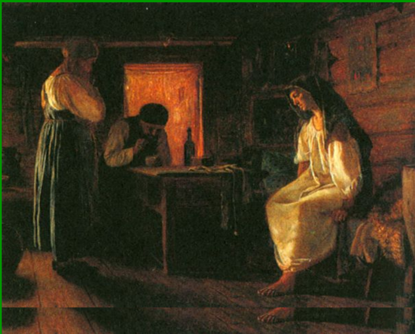
Знахарки на Руси