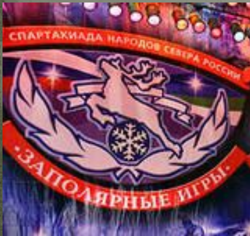
XIV Спартакиада народов Севера России "Заполярные игры", 3 ноября 2012