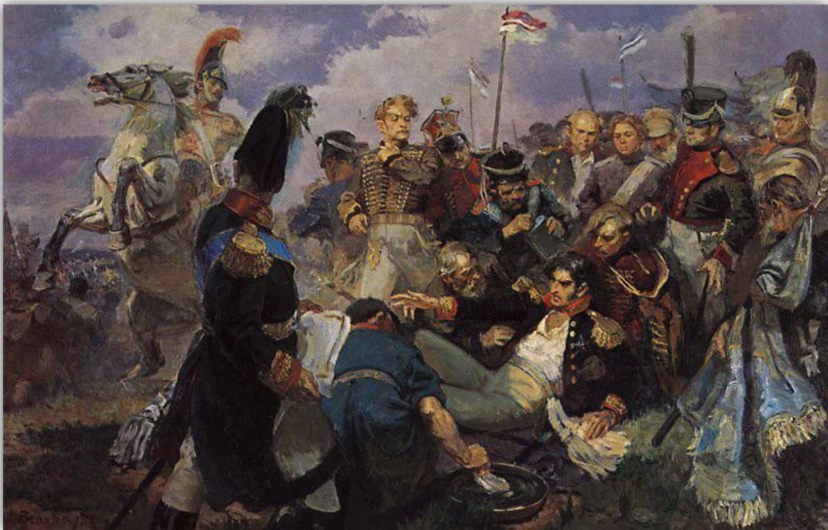
Смертельное ранение генерала Багратиона на Бородинском поле. Художник А. Венхадзе. 1948 г.