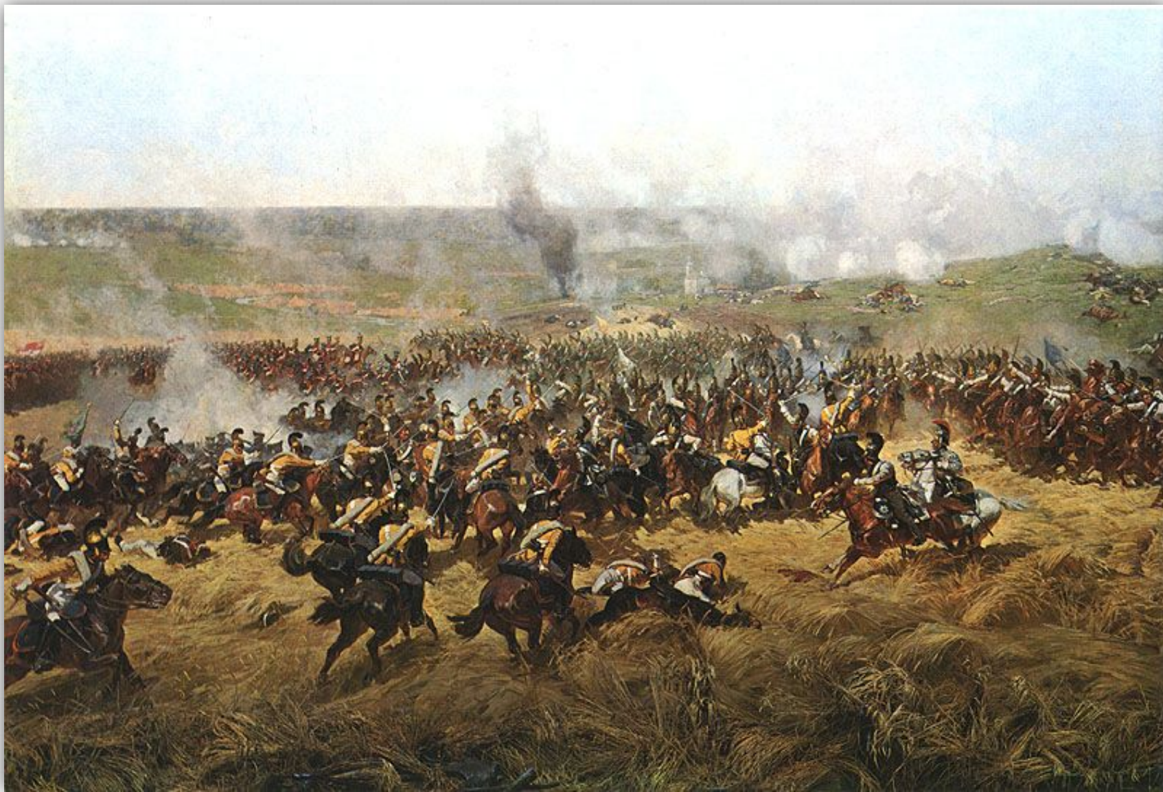
Бородинское сражение в 12:30. Саксонские кирасиры и польские уланы сталкиваются с русскими кирасирами. Справа - батарея Раевского, на заднем фоне церковь. Франц Рубо, 1912