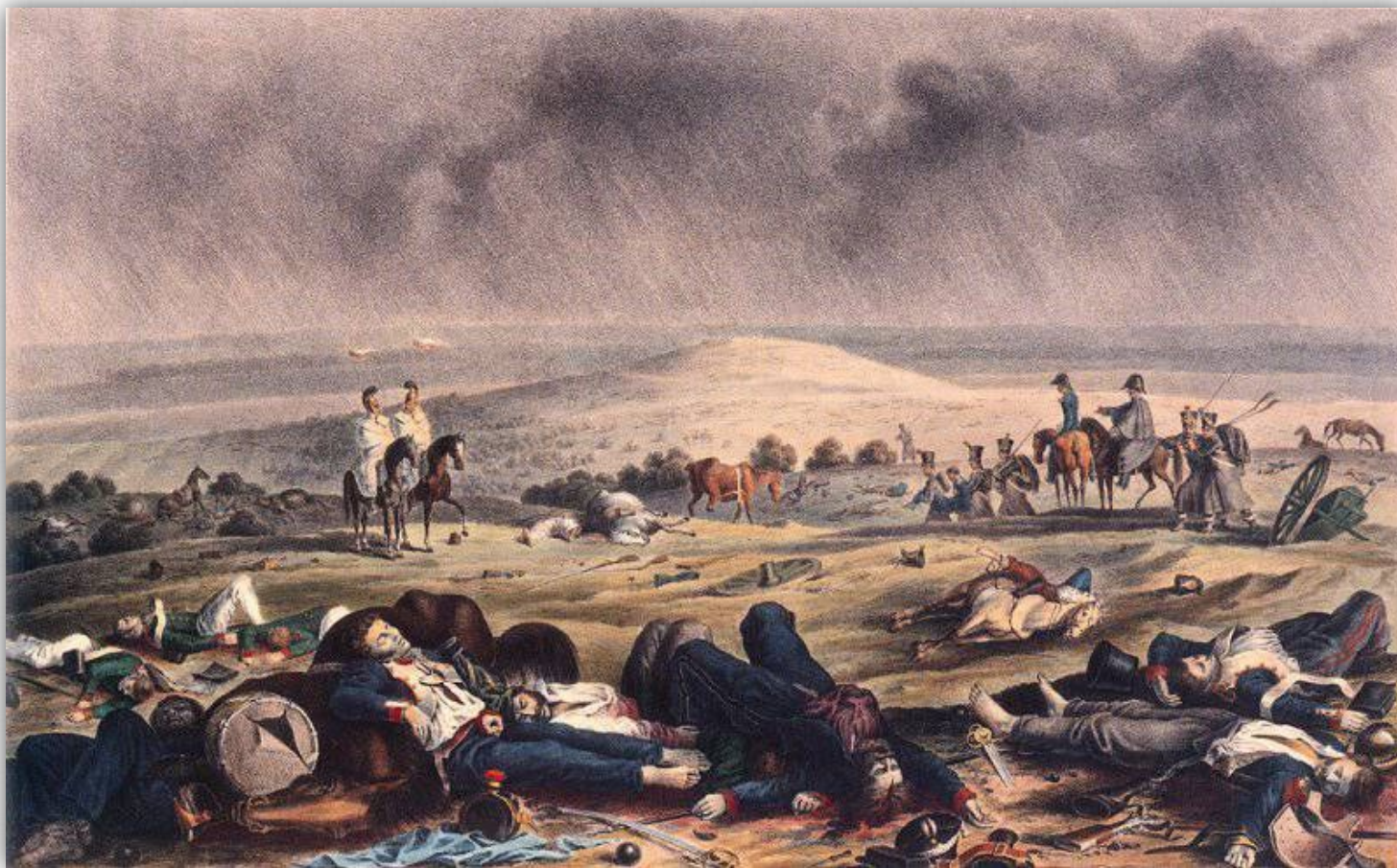
Х. В. Фабер дю Фор «На Бородинском поле, 17 сентября 1812 г.»

Главным достижением генерального сражения при Бородине стало то, что Наполеон не сумел разгромить русскую армию, а в объективных условиях всей Русской кампании 1812 года отсутствие решающей победы предопределило конечное поражение Наполеона.