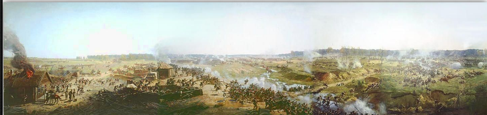
Бой за Семёновский овраг. Фрагмент панорамы Бородинского сражения. Рубо (1912)

После того как русские оставили флеши и закрепились за Семеновским оврагом, здесь произошла третья схватка, в ней участвовали войска, нападавшие на флеши и оборонявшие их. К французам присоединилась тяжелая конница генерала Нансути, к русским войскам подтянулись казаки Платова и кавалерия Уварова.