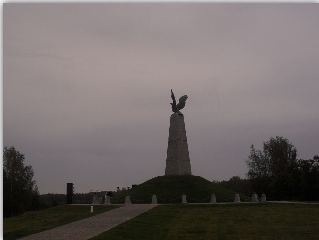
Памятник «Мёртвым великой армии» на Шевардинском редуте

Бородинское сражение ознаменовало собой кризис французской стратегии решающего генерального сражения. Французам в ходе сражения не удалось уничтожить русскую армию, вынудить капитулировать Россию и продиктовать условия мира. Русские же войска нанесли существенный урон армии противника и смогли сохранить силы для грядущих сражений.