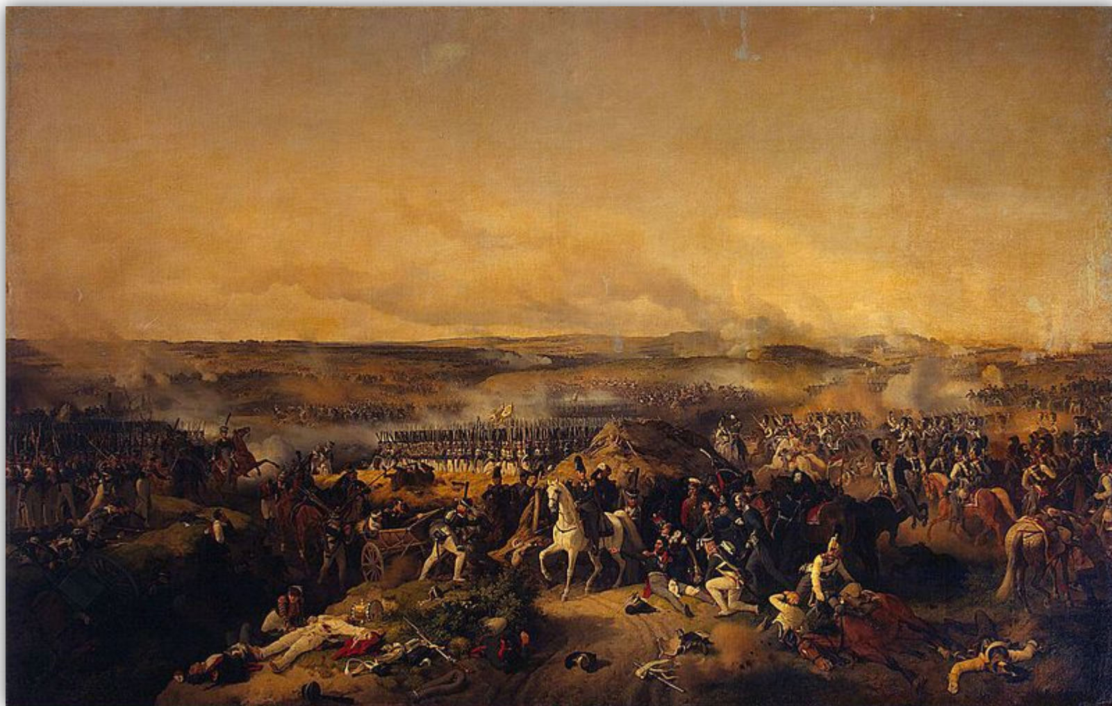
Бородинское сражение. В центре картины раненый генерал Багратион, рядом с ним на коне генерал Коновницын. Вдали виднеется каре лейб-гвардии. Художник П. Гесс, 1843 г.