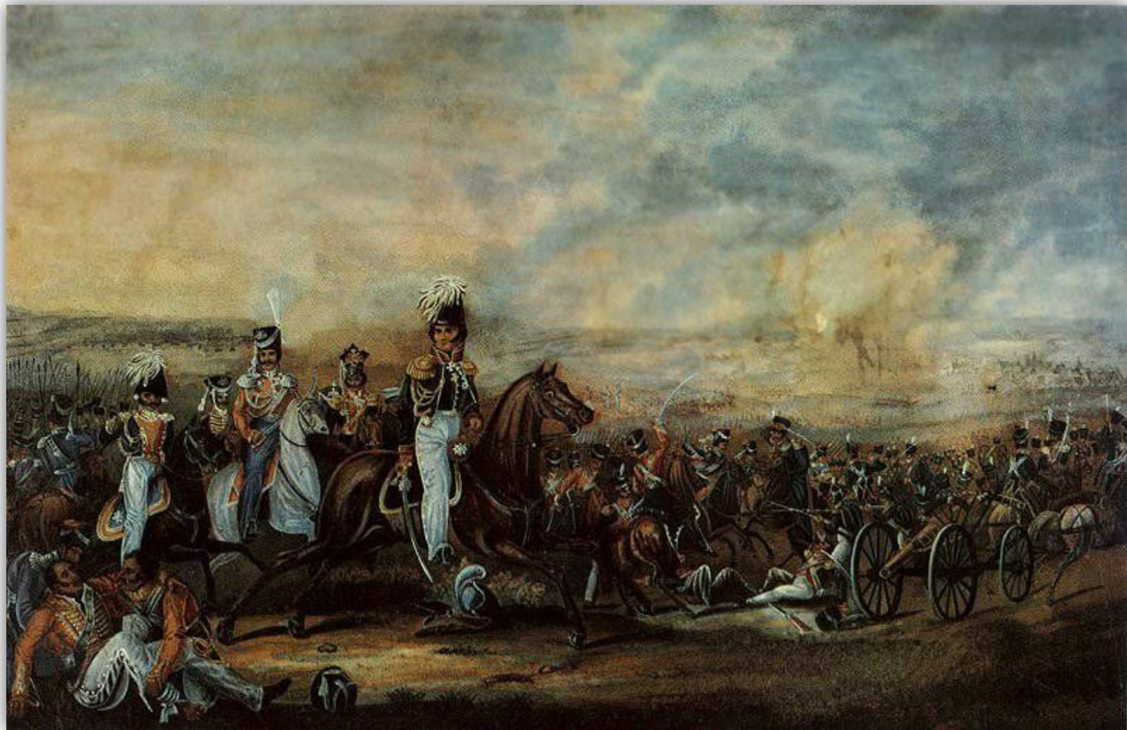
Кавалерийская атака генерала Ф. П. Уварова. Раскрашенная литография С. Васильева по оригиналу А. Дезарно. 1-я четверть XIX в.