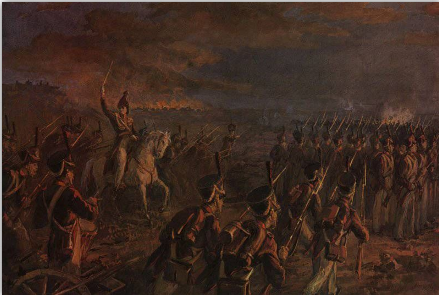
Подвиг солдат генерала Горчакова. Художник Ю. Цыганков. 1955 г.

За этот день редут поочередно переходил то к одной стороне то к другой, но вечером Кутузов приказал войскам Горчакова, оборонявшим редут, отойти к основным силам.