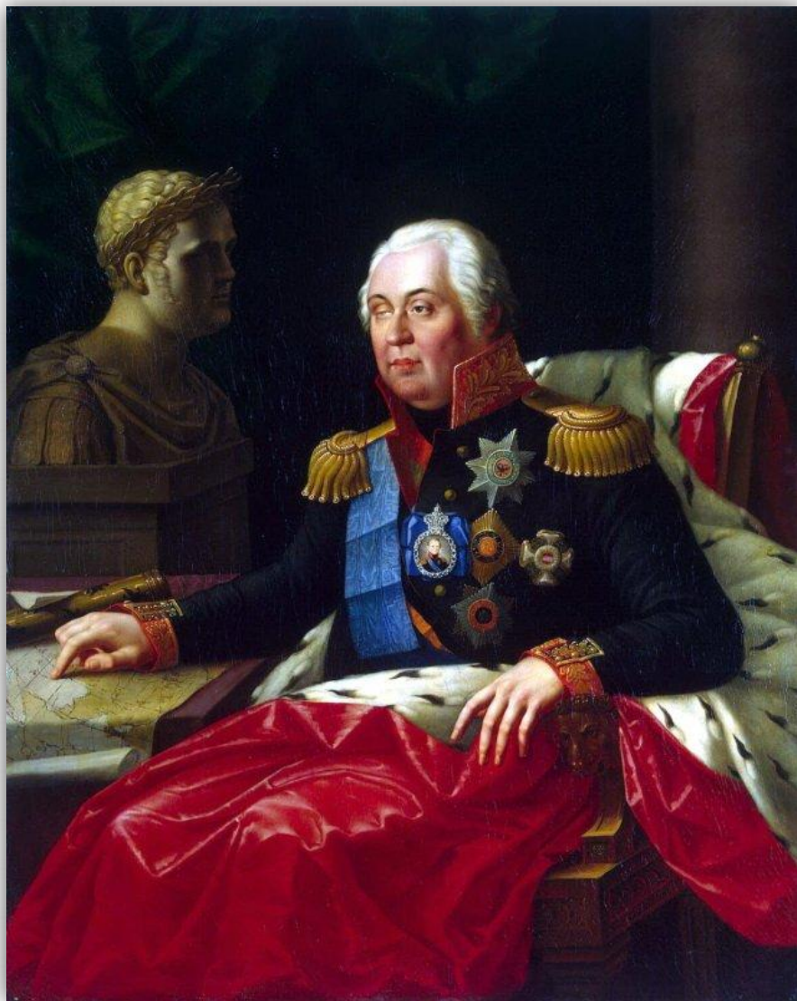
Портрет Михаила Илларионовича Кутузова. Художник Олешкевич Иосиф Иванович