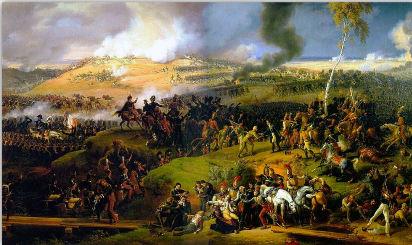
Бородинское сражение. Louis Lejeune, 1822

Бородинское сражение, или Бородинская битва (во французской истории — битва у Москвы-реки), — крупнейшее сражение Отечественной войны 1812 года между русской армией под командованием генерала от инфантерии М. И. Кутузова и французской армией под командованием императора Наполеона I Бонапарта.