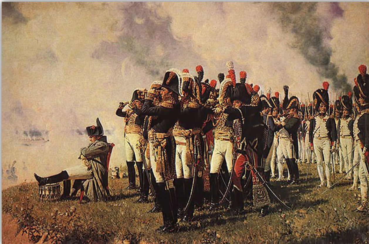
Наполеон на Бородинских высотах. В.В. Верещагин, 1897

Наполеону, к 1812 году, покорилась почти вся Европа. Он использовал оставшуюся военную мощь покоренных ему народов и собрал огромную армию (приблизительно 600 тысяч человек), для наступления на Россию и в дальнейшем для ее захвата. Численность Российской армии, была втрое меньше армии французского императора.