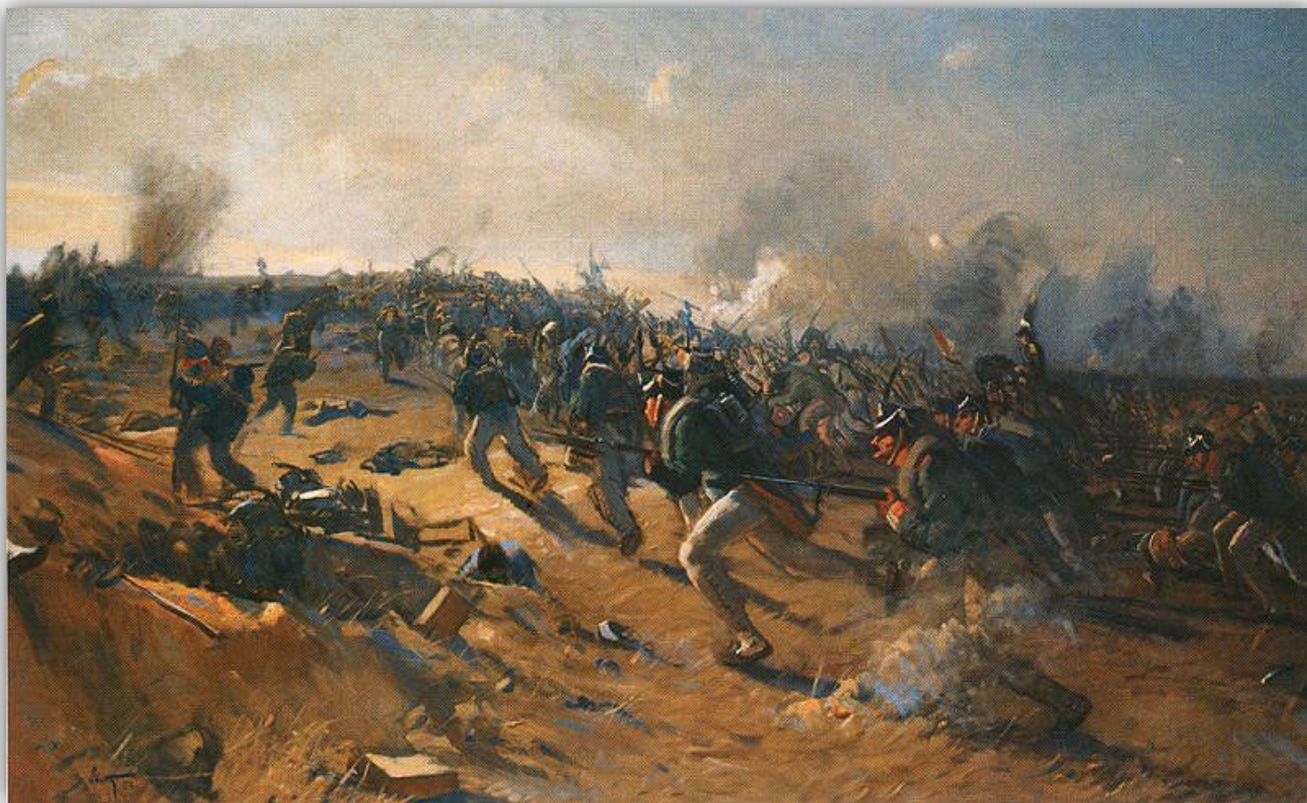
2-я гренадерская дивизия отбивает Шевардинский редут. Художник И.В. Евстигнеев. 1956 г. Холст, масло. 90x150. Музей-заповедник «Бородинское поле».

Самому генеральному сражению предшествовала схватка за Шевардинский редут, продолжавшаяся весь день 24 августа.