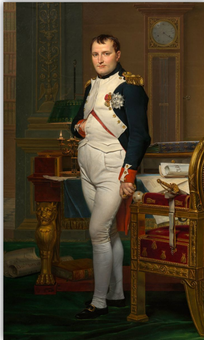
Портрет Наполеона в кабинете дворца Тюильри. Художник Жак-Луи Давид, 1812.