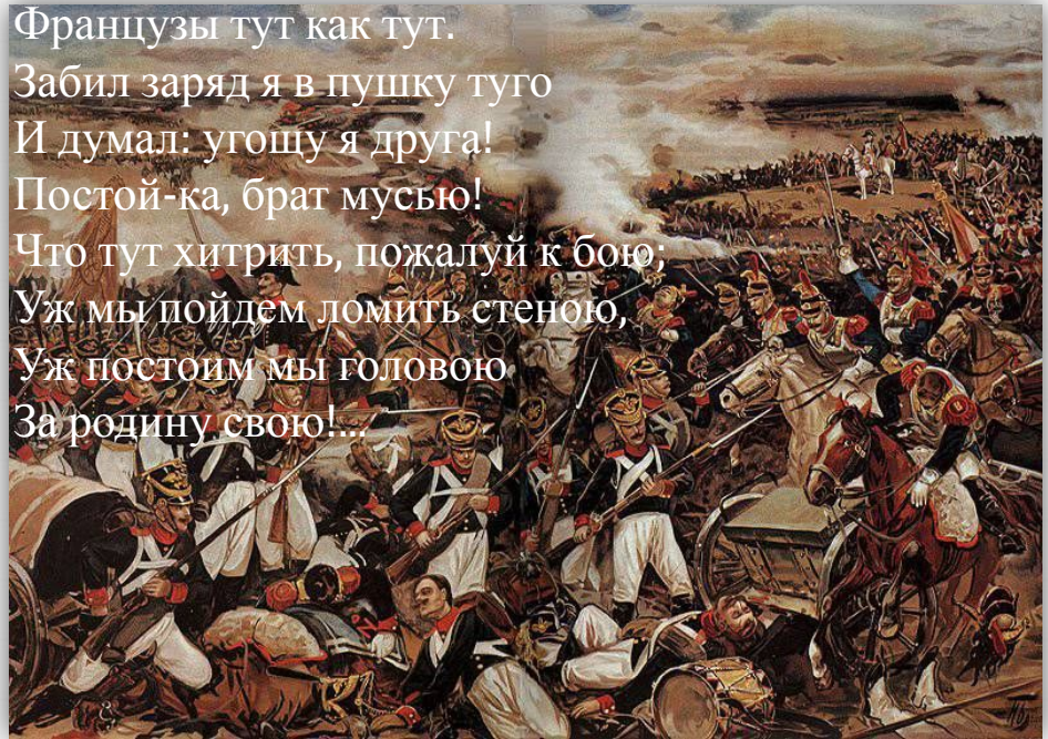
Эпизод Бородинского сражения. Иллюстрация к стихотворению М. Ю. Лермонтова «Бородино». Хромолитография Н. Богатова.