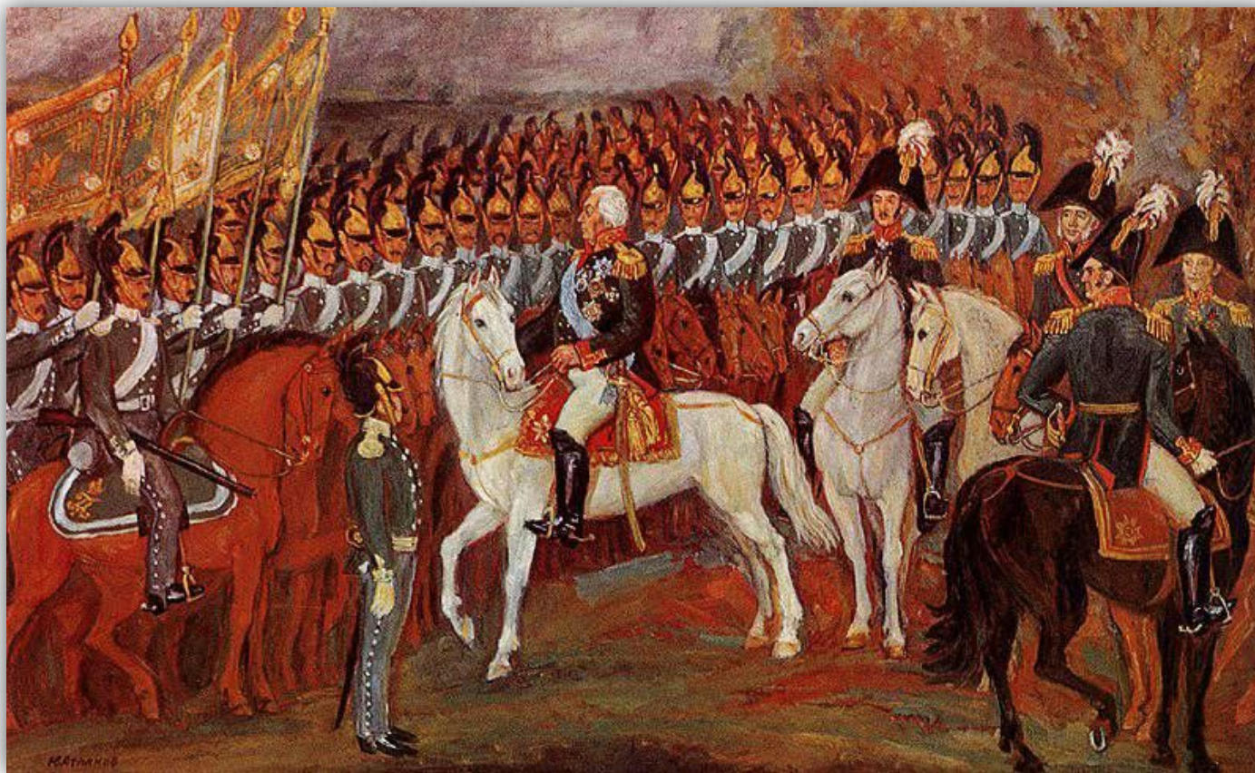
Обращение М. И. Кутузова к войскам накануне Бородинского сражения. Художник Ю. Атланов. 1982 г.

Основной причиной, по которой русские войска дали бой при Бородино, было желание ослабить французскую армию и задержать ее продвижение к Москве. Для этого Кутузов перекрыл Новую Смоленскую дорогу, где наступали французы, сосредоточив на этом участке почти три четверти сил.