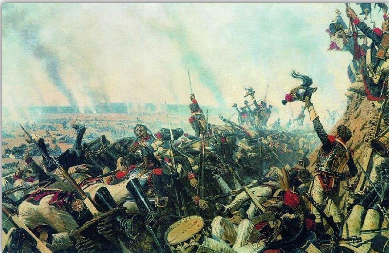
Конец Бородинского боя. В.В. Верещагин (около 1899)

И хотя французами были захвачены все ключевые позиции, к вечеру 26 августа, они были вынуждены отступить и оставить территории русским. Но, Кутузов, понимая, что у него осталось чуть больше половины первоначального количества людей (кстати, французы потеряли еще больше – почти 60 тысяч человек), принял решение отступить к Москве.