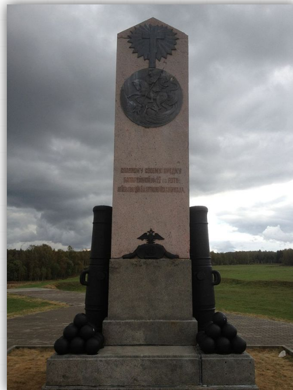
Монумент внутри бывших валов Шевардинского редута