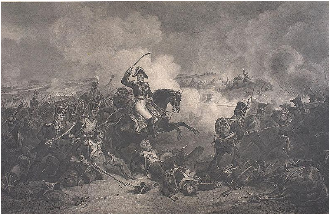
Атака маршала Нея при Бородине. Гравюра по картине Ланглуа, 19 в.

Схватка за Багратионовы флеши, в которой против двух дивизий под командованием Неверовского и Воронцова были выдвинуты 15 дивизий маршалов Нея, Даву, Мюрата и генерала Жюно. Именно здесь был ранен Багратион и командование принял генерал Коновницын.