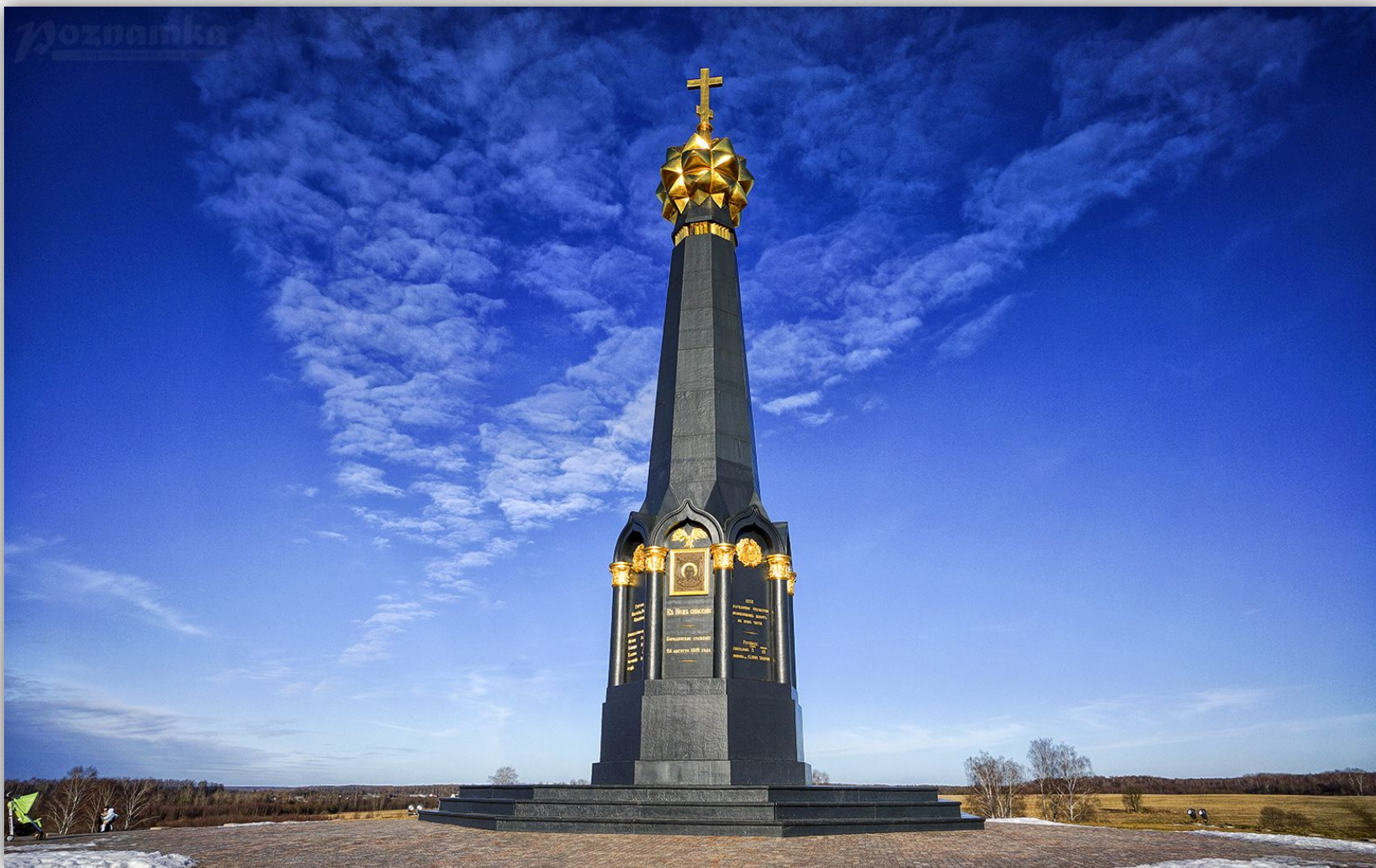
Бородинское поле. Бородинский военно-исторический музей-заповедник.