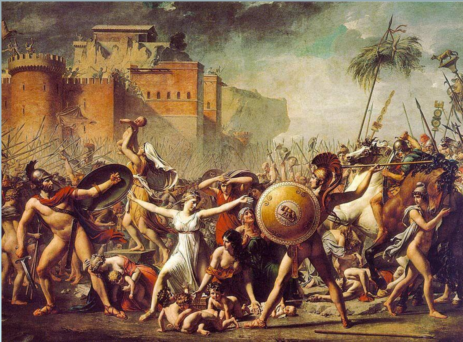
Жак-Луи Давид. Сабинянки. 1799