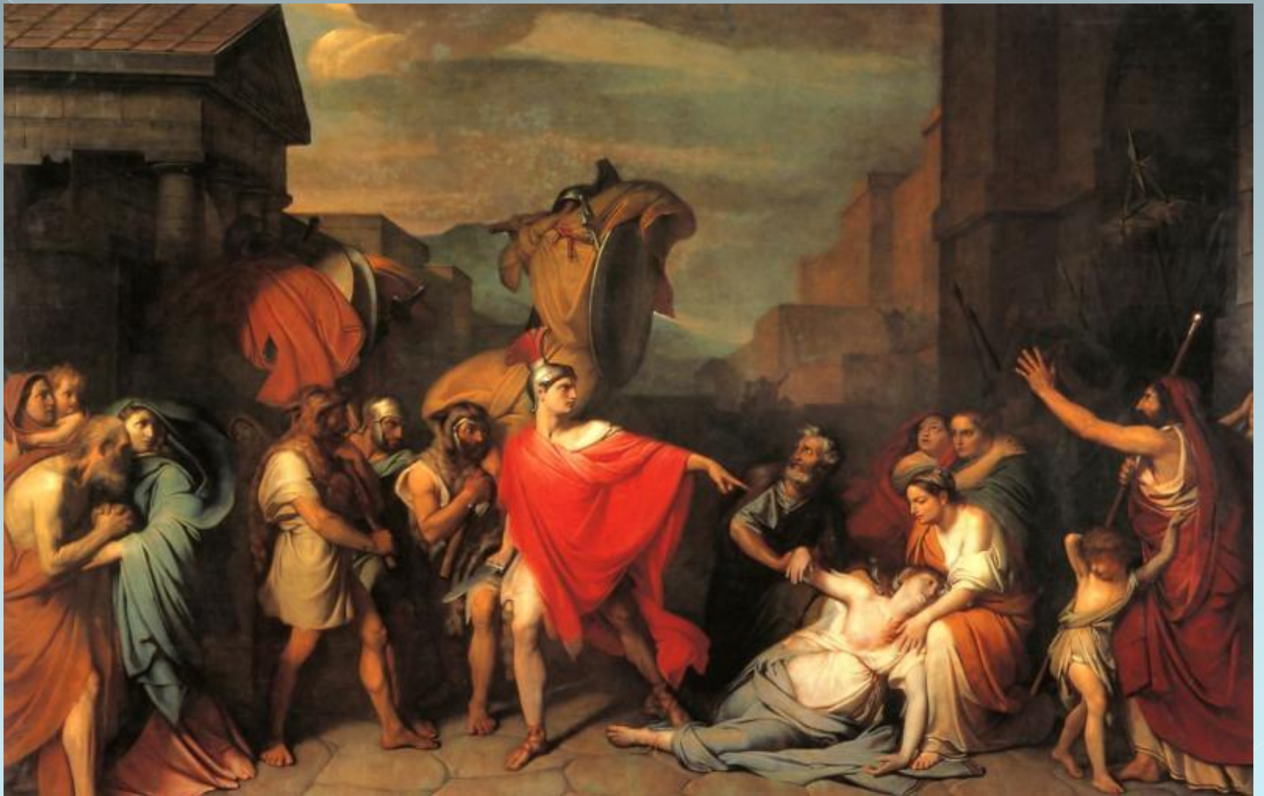
Ф. Бруни. Смерть Камиллы, сестры Горація. 1824 г.