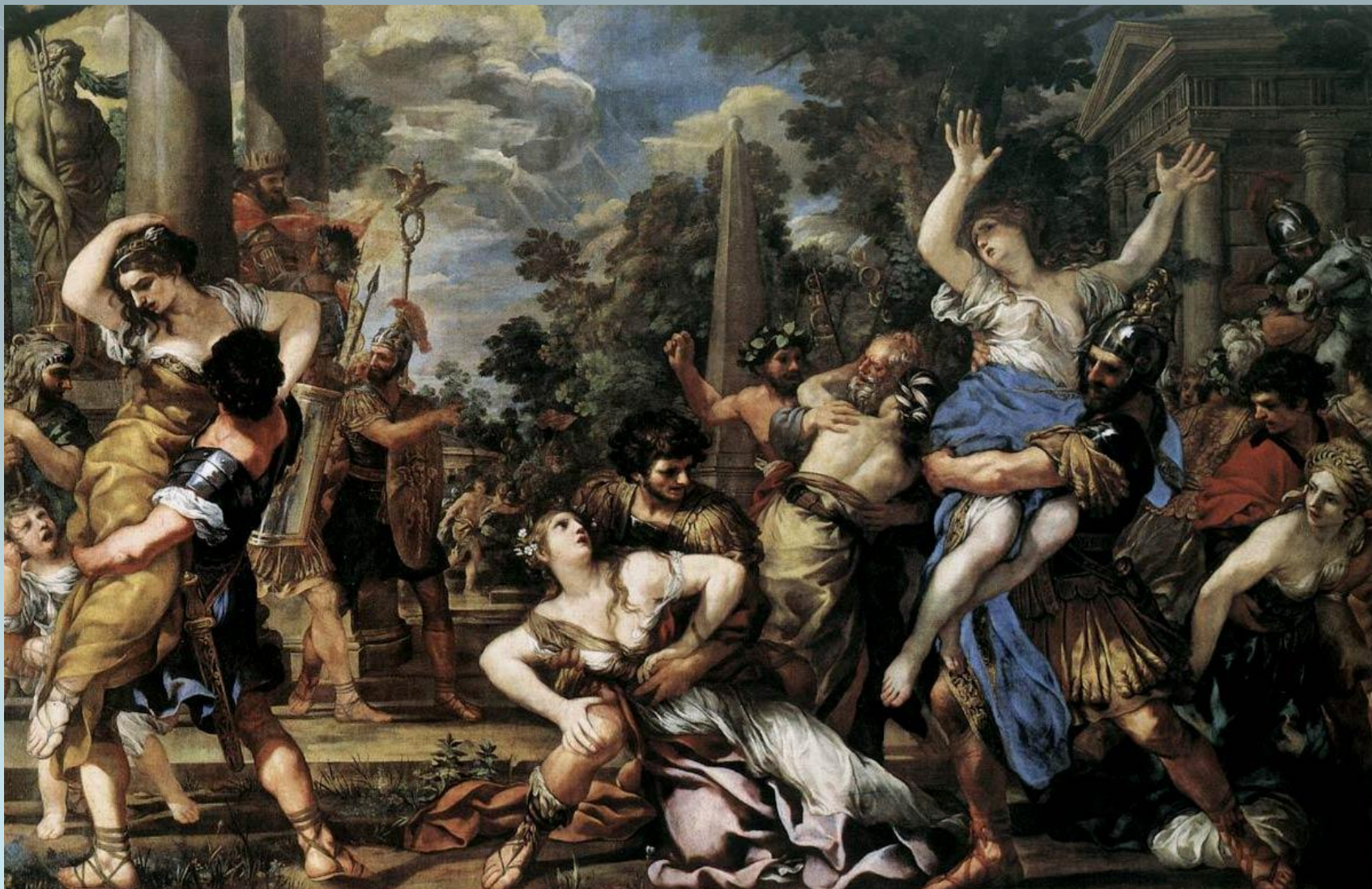
П. Береттини. Похищение сабинянок. Ок. 1629