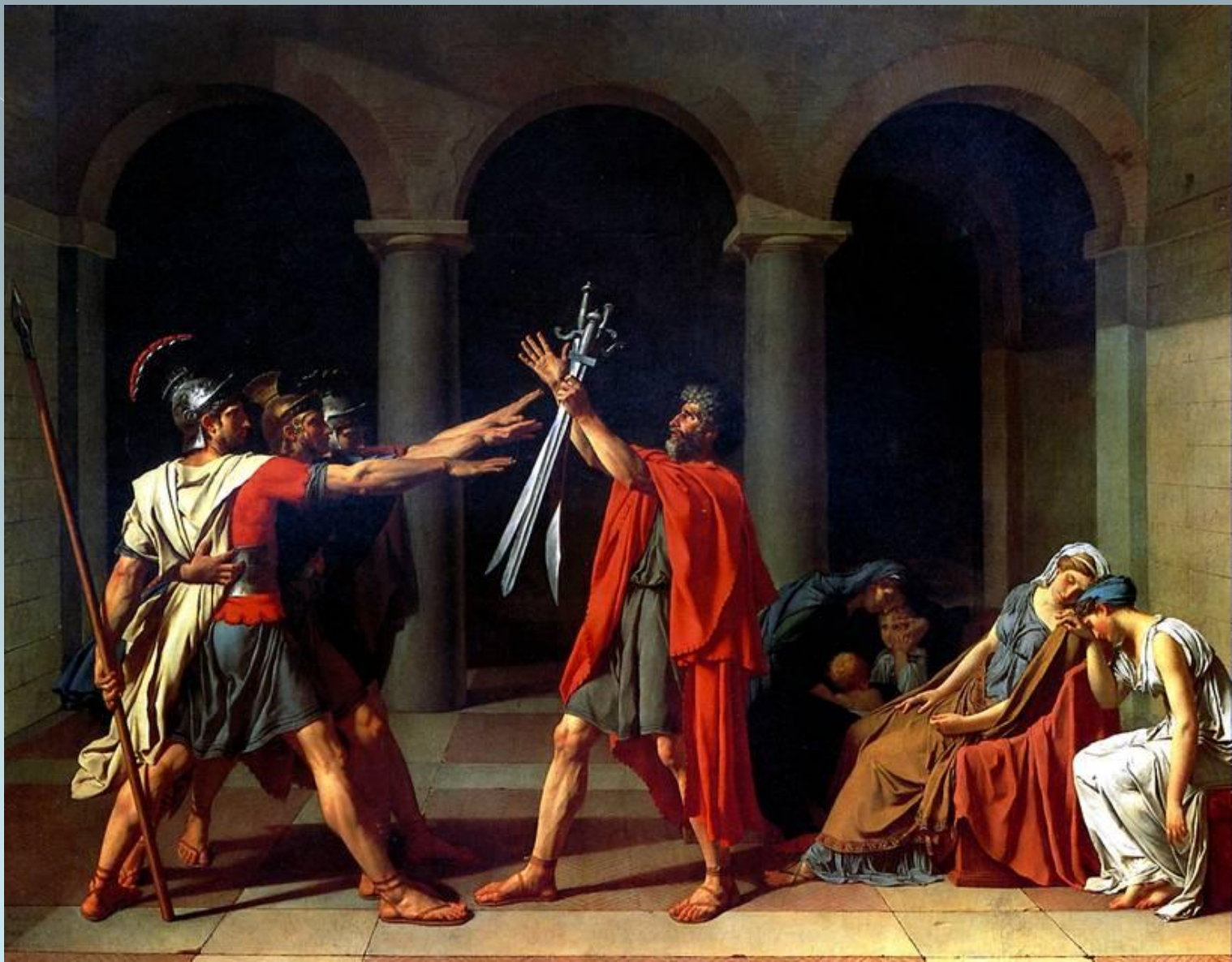
Жак-Луи Давид. Клятва Горацев. 1784 г.