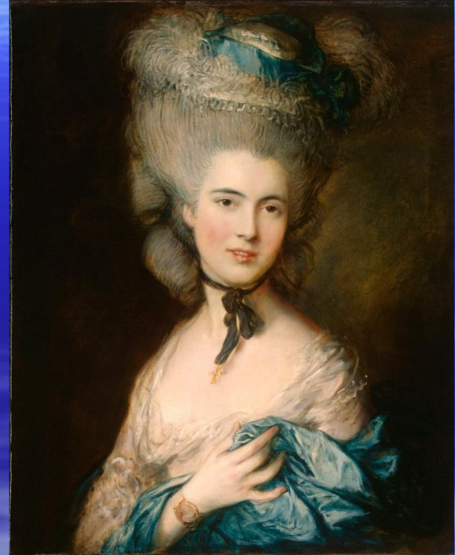
Гейнсборо, Томас Женщина в голубом (1780)