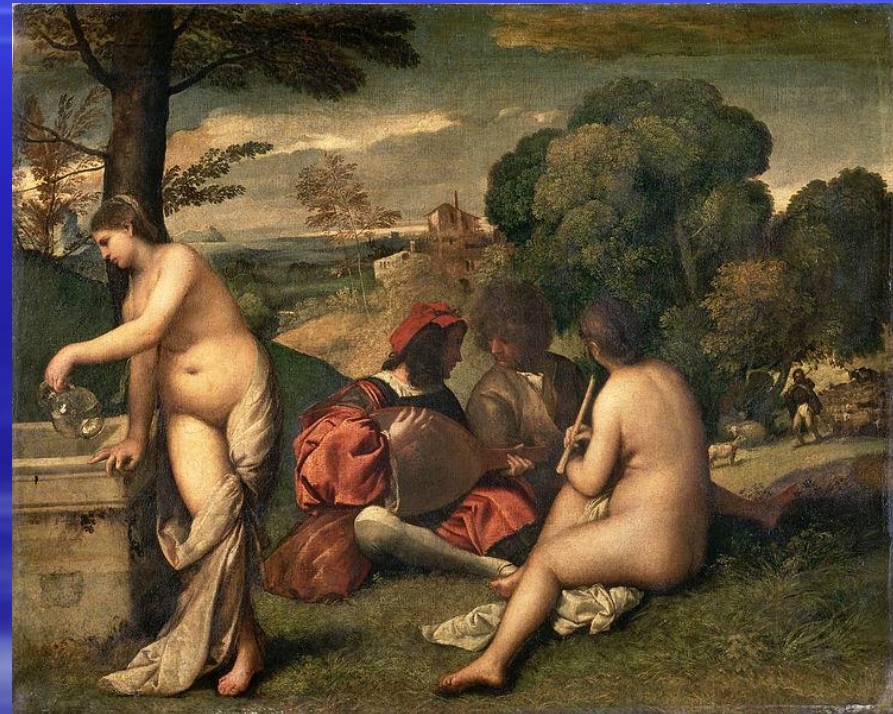
■ «Сельский концерт» ■ Джорджоне, ок. 1510 г.