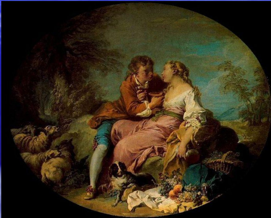
■ Ф. Буше. Пастораль