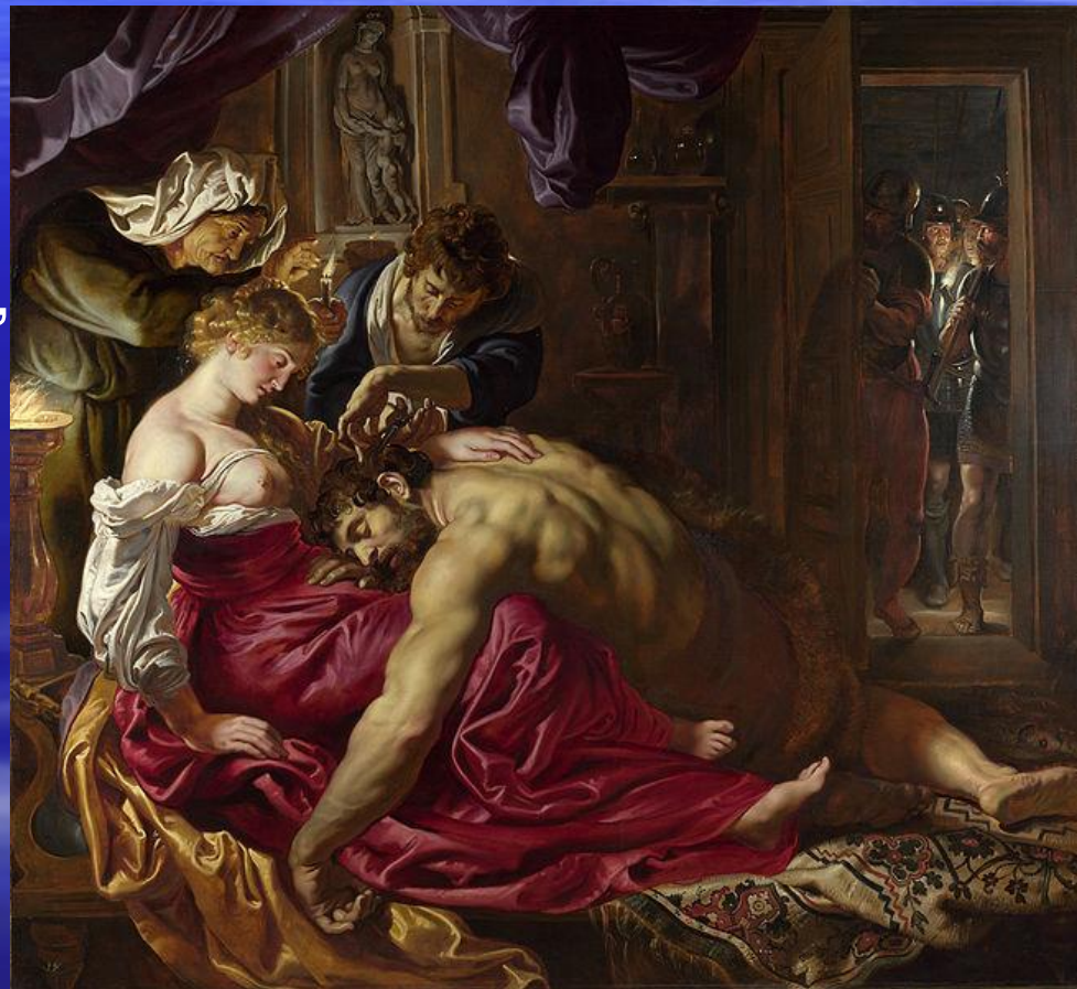
« Самсон и Далила », 1609