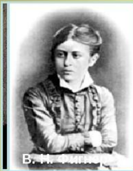
В. Н. Фигнер