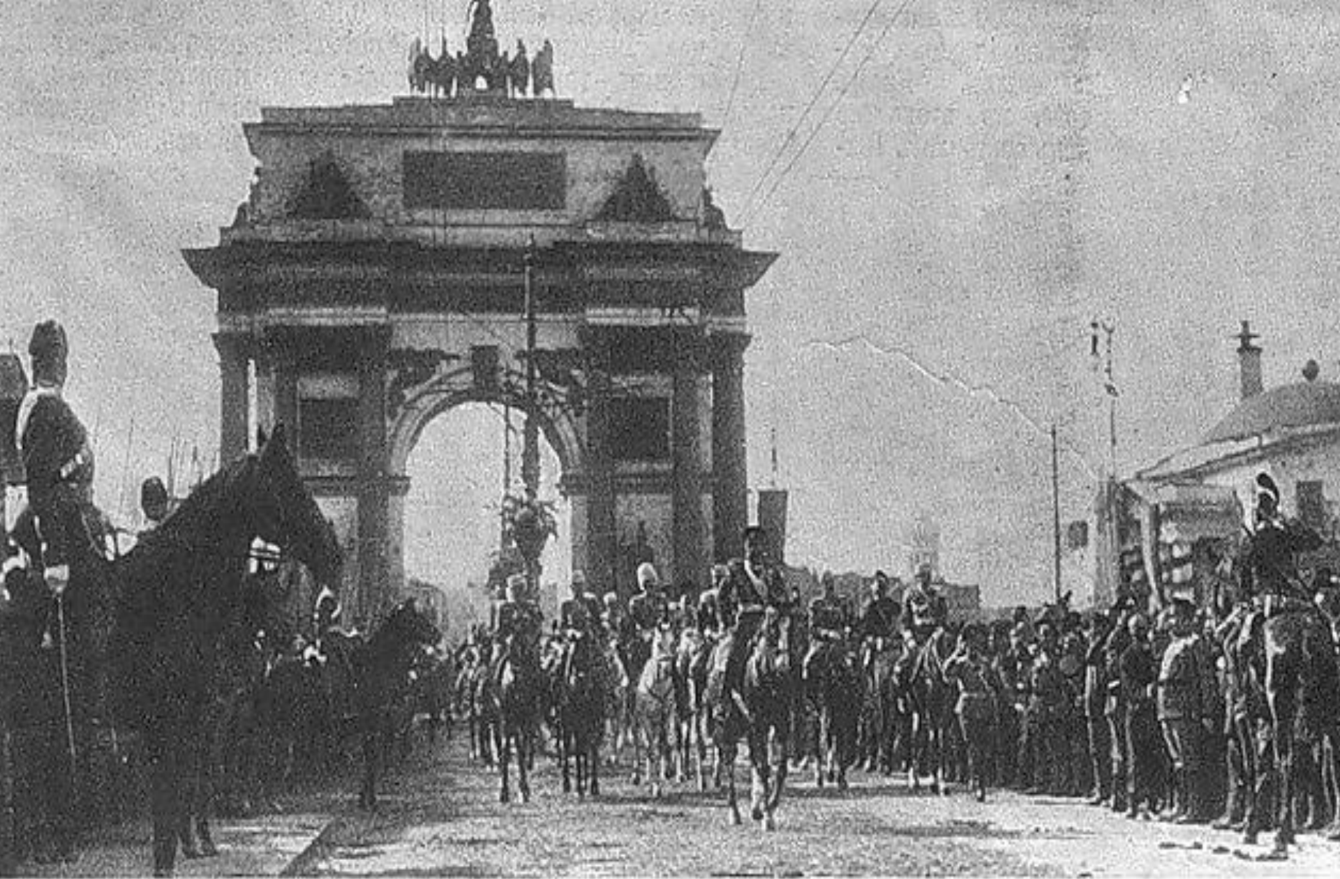
Москва. Высочайшій проѣздъ Ихъ Величествъ по Тверской улицѣ у Триумфальныхъ воротъ вѣнчающагося празднованія 300-лѣтія Дома Романовыхъ въ Ростовѣ (Яросл. губ.), 22 мая, 1913 г.