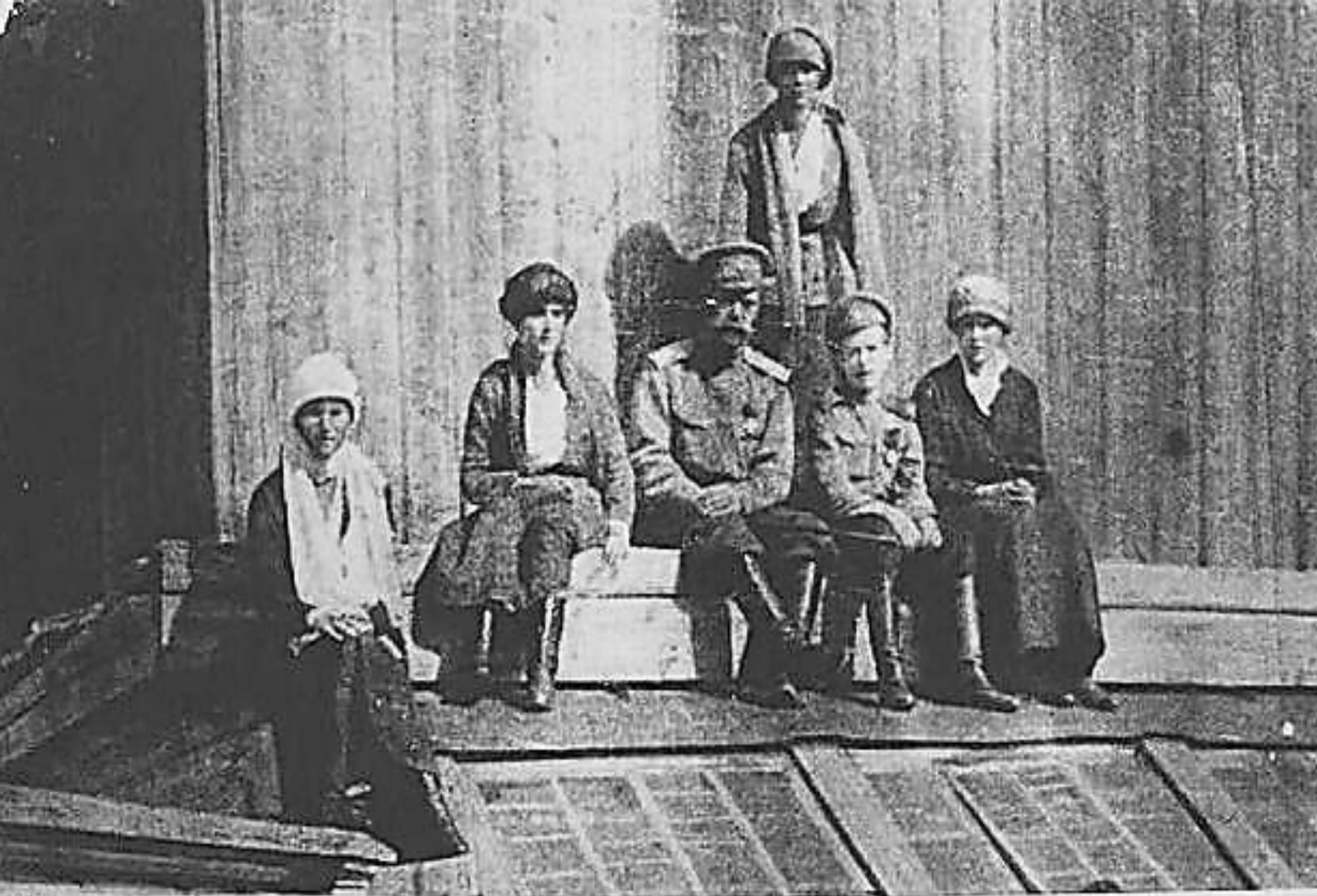
Августейшая Ольга Романовна в Новооскере Сибире 1917г - Апрель 1918г.