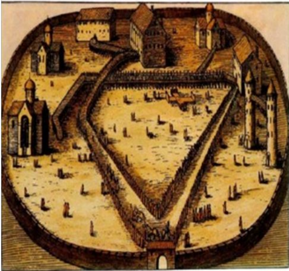
Александровская слобода. Гравюра XVI в.