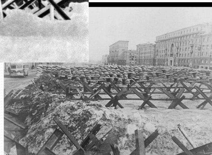
Репортаж из дня вчерашнего