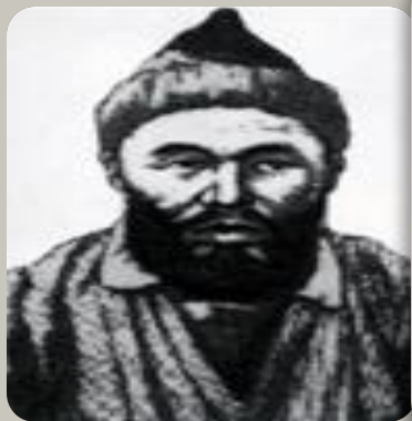
ЕСЕТ БАТЫР (1807-1888)