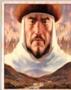
ЖАНИБЕК БАТЫР (1693 - 1752)