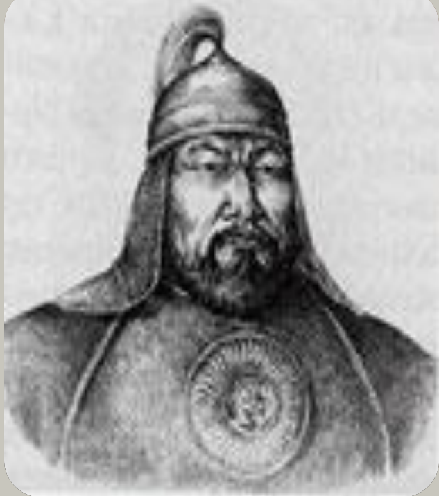
КАБАНБАЙ БАТЫР (ок.1691/2 – ок.1769/70)

Воспользовавшись разногласием среди владетелей трех жузов (только лишь в Среднем жузе было три хана: Болат, Семене, Абулмамбет), в 1714 году джунгары повторили внезапное вторжение в Казахстан. Страна оказалась в сложной ситуации. Даже решительные действия Казахского ополчения весной 1718 г. в районе р. Аягуз под предводительством известных батыров Кара Керей Кабанбая и Шакантая (Жаугашар) не смогли поправить сложную ситуацию, в которой оказался Средний жуз.