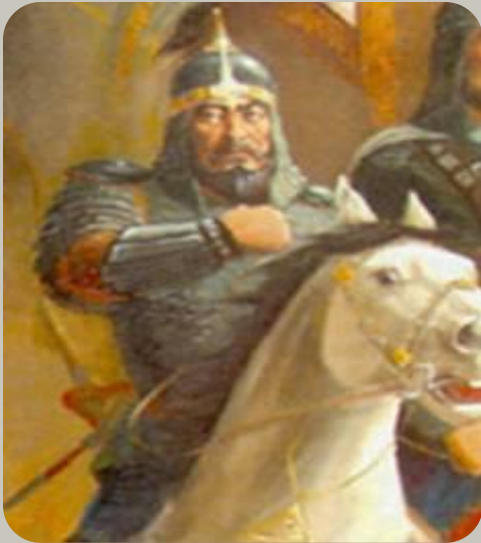
БОГЕНБАЙ БАТЫР (1690 - 1775)

Первый курултай (народное собрание кочевников) состоялся летом 1710 г. в районе Каракума. Было решено создать общеказахское ополчение во главе с видным народным батыром Богенбаем. Осознание реальной угрозы, нависшей над Казахстаном, дало и первые плоды — в 1711 г. военные силы трех жузов дали отпор врагу. Джунгары отступили к востоку. А в следующем году казахские отряды вторглись в пределы Джунгарского ханства. Ответный поход джунгарского хунтайшы в 1713 г. окончился провалом. Но первые плоды совместной борьбы не были