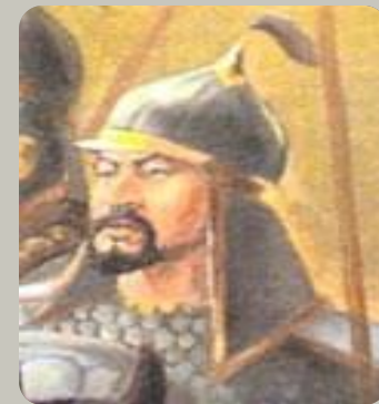
КАРАСАЙ БАТЫР (1598 - 1671)

В этот критический момент дело спасения страны взял на себя сам народ, выдвинув из своей среды крупных предводителей народного ополчения: Кара Керей Кабанбая, Шакшак Жа-нибека, Наурызбая, Букенбая, Малайсары, Баяна, Есета, Райымбека, Шакантая и др. Мудрые вдохновители освободительной борьбы Каздауысты Казыбек, Айтеке бий, Толебий сыграли выдающуюся роль в объединении усилий казахских родов в этот критический период.