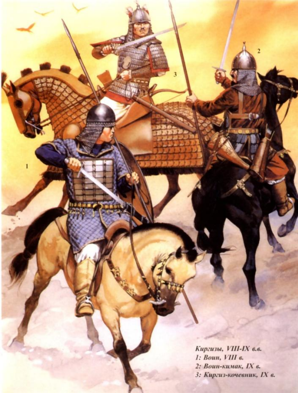
Киргизы, VIII-IX вв. 1: Воин, VIII в. 2: Воин-кимак, IX в. 3: Киргиз-кочевник, IX в.

В первой четверти XVIII в. наибольшая угроза для казахов нависла со стороны Джунгарского ханства, достигшего в 20-х годах наибольшего упрочения своего военного потенциала, политического веса в Центрально-Азиатском регионе. Существование Джунгарии, как сильного государства в непосредственной близости от границ Казахстана, представляло собою реальную угрозу не только для казахов, киргизов, узбеков, алтайских народов и других, но и для России, чьи экономические и политические интересы в зоне Алтайских горнозаводских предприятий побуждали как правительство, так и Сибирскую администрацию принимать энергичные меры противодействия против далеко идущих устремлений хунтайшы Цеван-Рабдана.