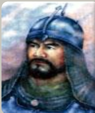
РАЙЫМБЕК БАТЫР (1705 – точная дата смерти неизвестна)