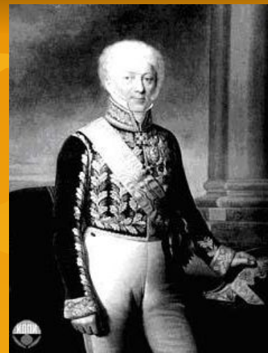
Н. Н. Новосильцев