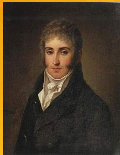
А. А. Чарторыский