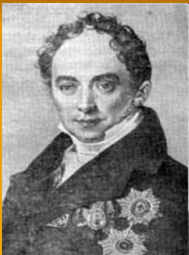
В. П. Кочубей