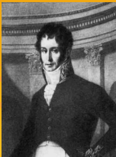
П. А. Строганов