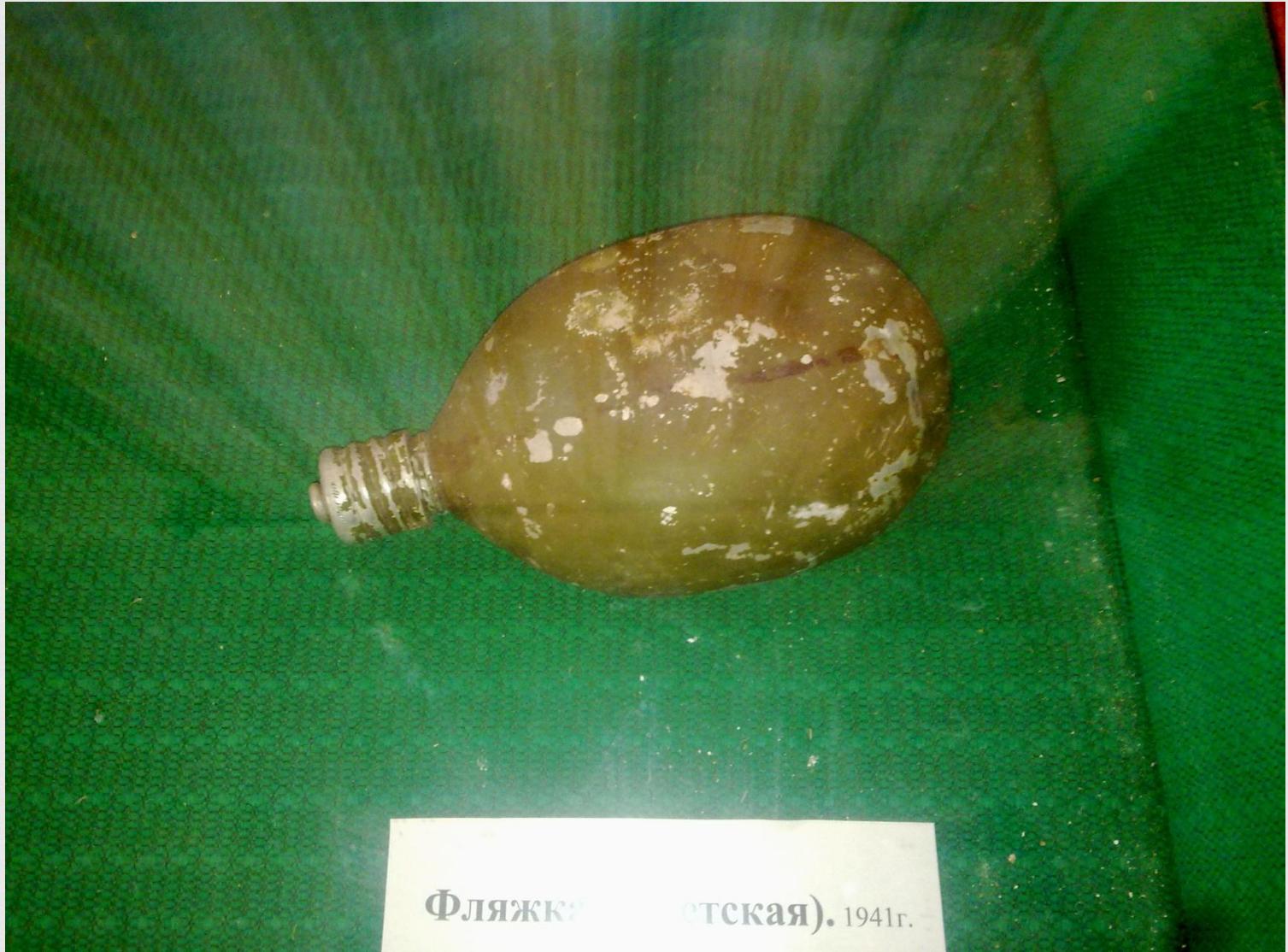
Фляжка (Ленинградская). 1941г.