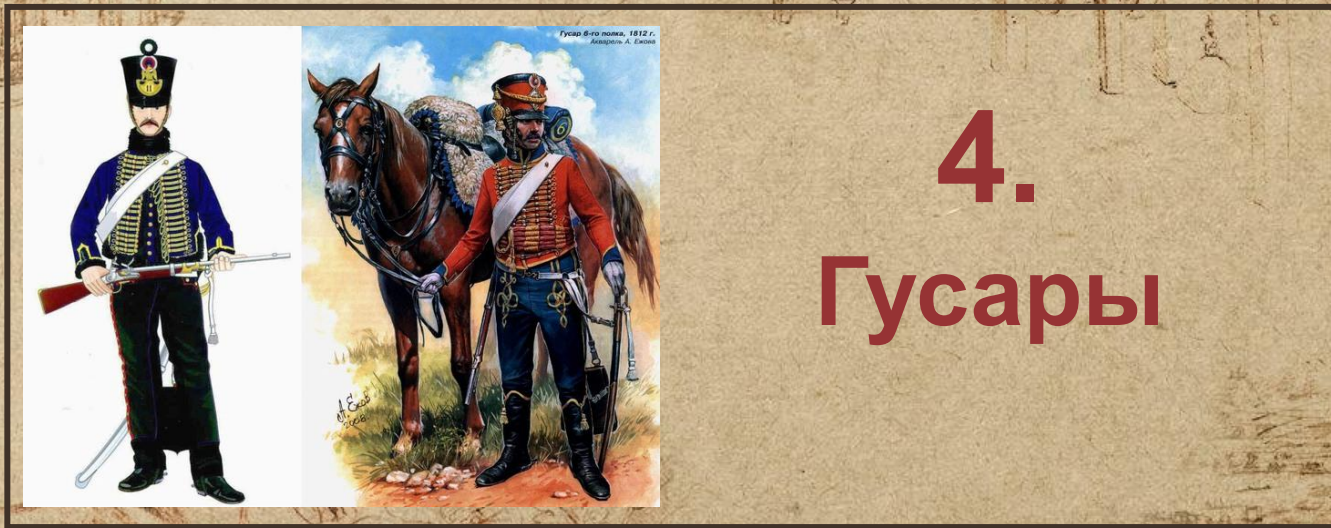
Гусар 8-го полка, 1812 г. Александр А. Бонин