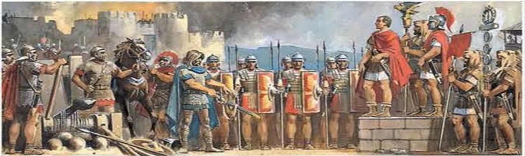
Вождь галлов сдается Цезарю

Цезарю понадобилось 10 лет для завоевания Заальпийской Галлии. Войны в Галлии принесли Цезарю славу талантливого полководца и преданное войско. Солдаты получали от Цезаря двойное жалование и рабов , они верили в его обещание наградить их земельными участками по окончании службы.