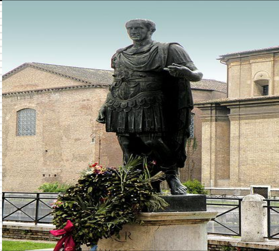
Памятник Цезарю в Риме