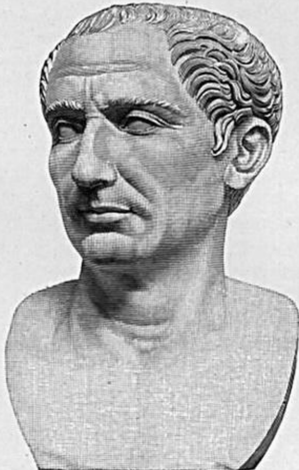
Гай Юлий Цезарь

Гай Юлий Цезарь родился 12 июля 100 г. до н.э. Он происходил из знатного рода , был умен , блестяще образован и красноречив .