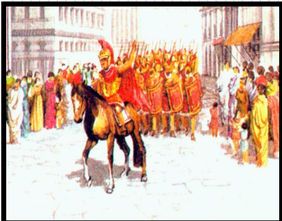
Вступление Цезаря в Рим

На улицах Рима Цезаря встречала беднота. Цезарь вошел в город без боя. Помпей и Сенат бежали на Балканы, собрали войско и двинулись на Рим. Но их ждала неудача – Цезарь разбил их армию. А сам Помпей вскоре погиб. Цезарь захватил власть в Риме в 49 г. до н. э.