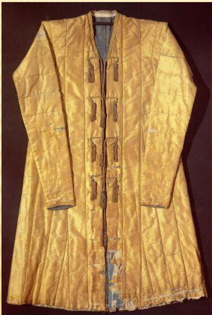
Ферезь царя Ивана Грозного, XVI в.