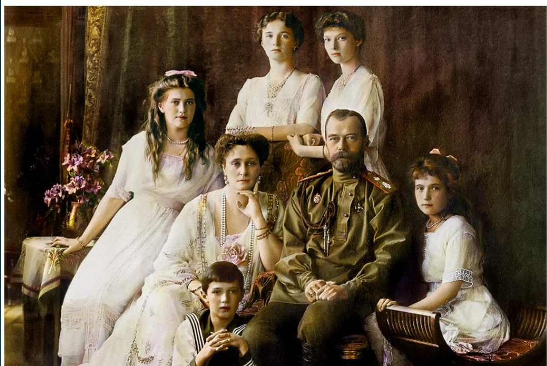
Photo Restoration online www.alstudioonline.com