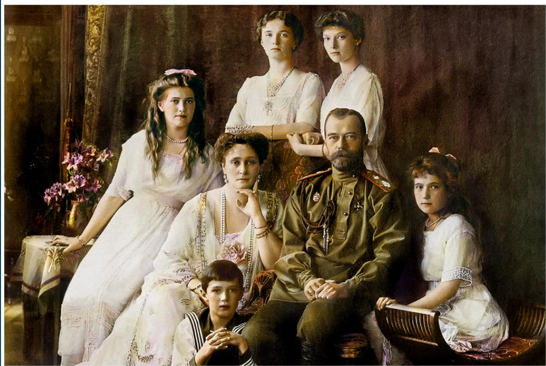
Photo Restoration online www.alstudioonline.com