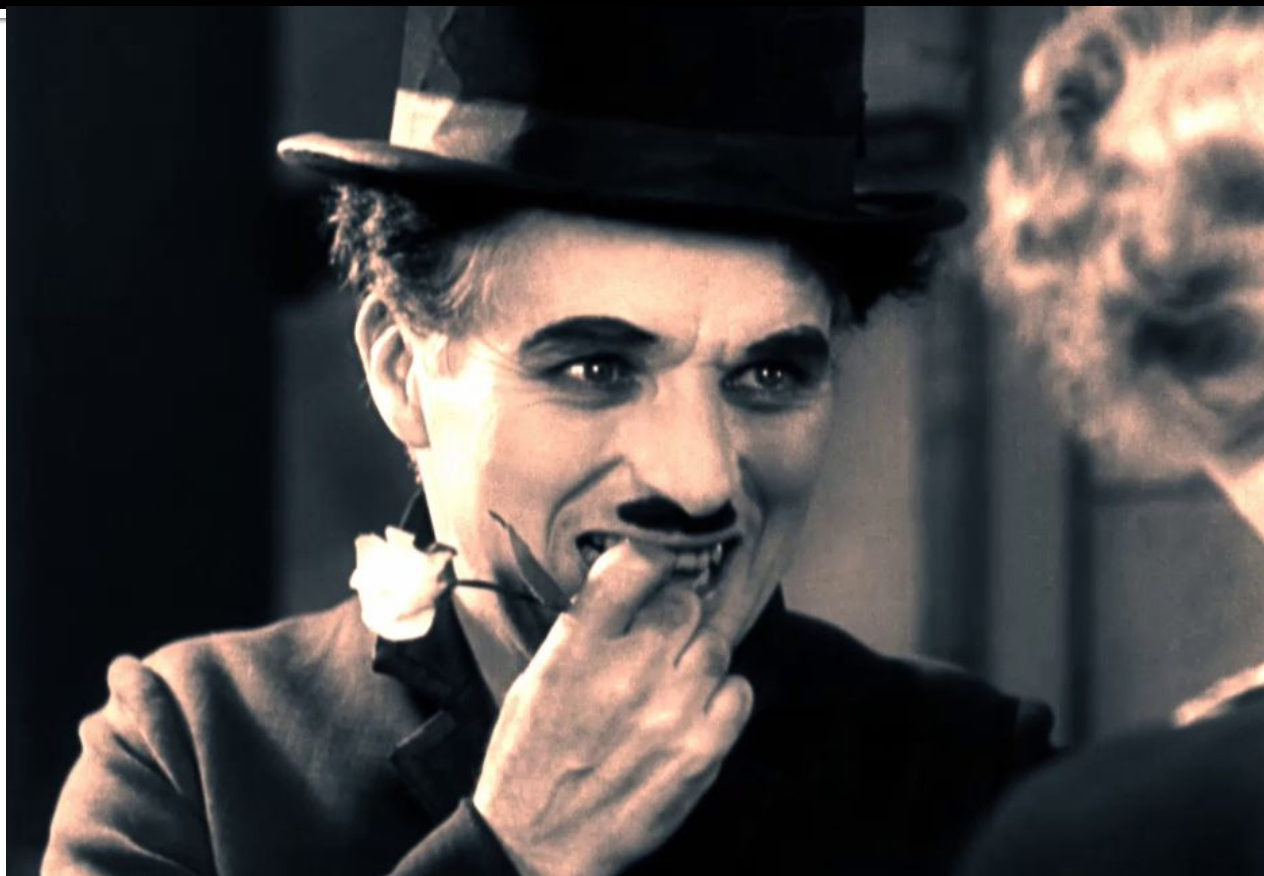
Чарли Чаплин в первом своём звуковом фильме «Огни города»( «Огни большого города»)