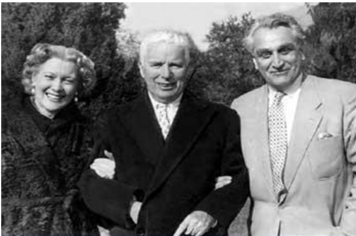
Любовь Орлова, Чарли Чаплин, Григорий Александров