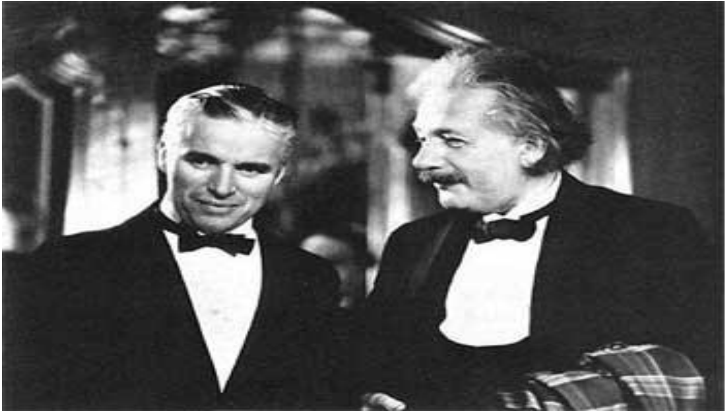
Чарли Чаплин без грима и Альберт Эйнштейн