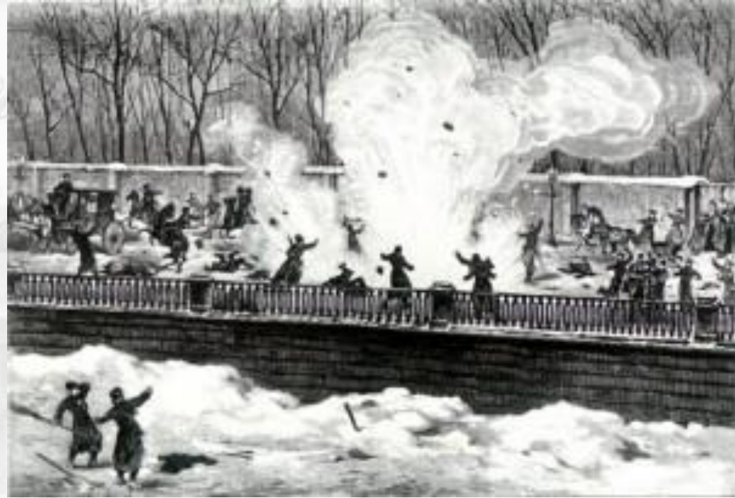
Покушение на царя.

А потом, больше ста лет назад, появилось много разных революционеров – и такие, что создавали кружки образования для рабочих, и террористы, кидавшие бомбы, и такие, что боролись за счастье угнетенных народов, или – крестьян всей страны. Революционеров было мало, часто их ссылали в Сибирь, на каторгу, или в тюрьму, или вешали.