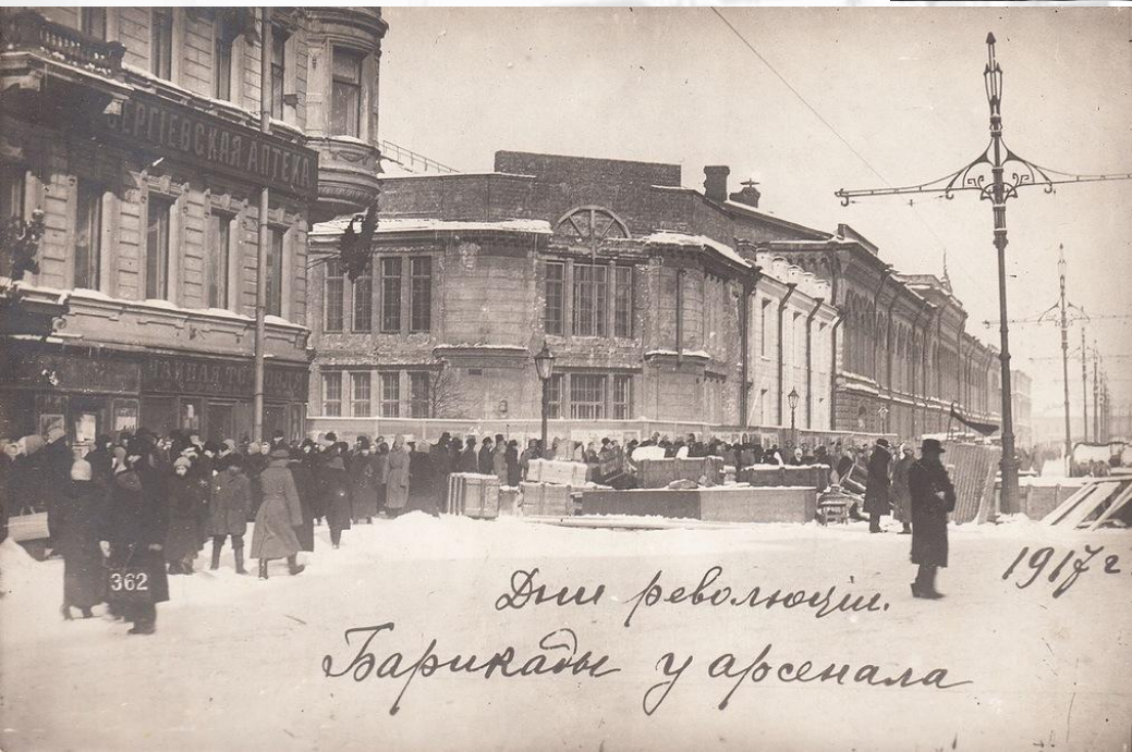
Дни революции. Баррикады у арсенала