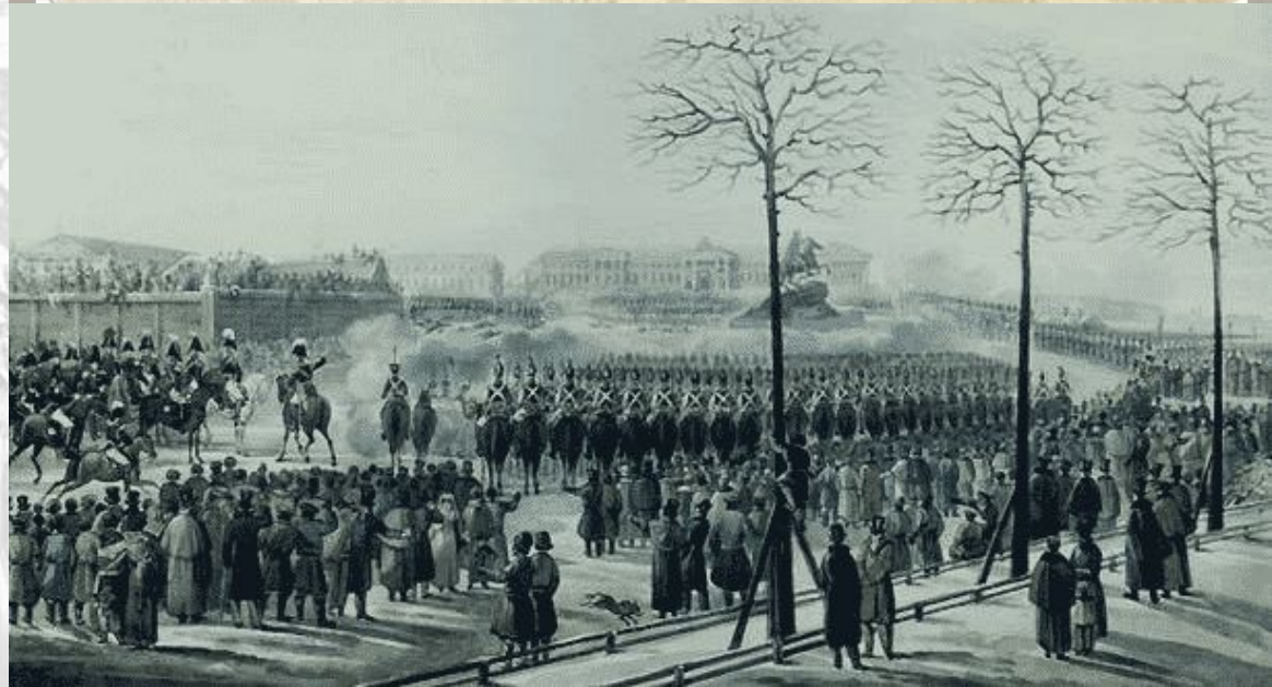
Восстание 14 декабря 1825 г. в Петербурге

Людей, которые хотели дать народу равноправие, называли революционерами. Сначала, еще в XIX веке это были дворяне-декабристы, потом разночинцы-народовольцы, которые даже пытались убить царя.