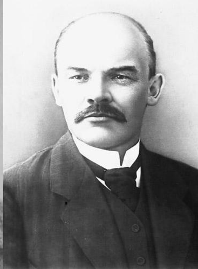
Владимир Ульянов (Ленин)