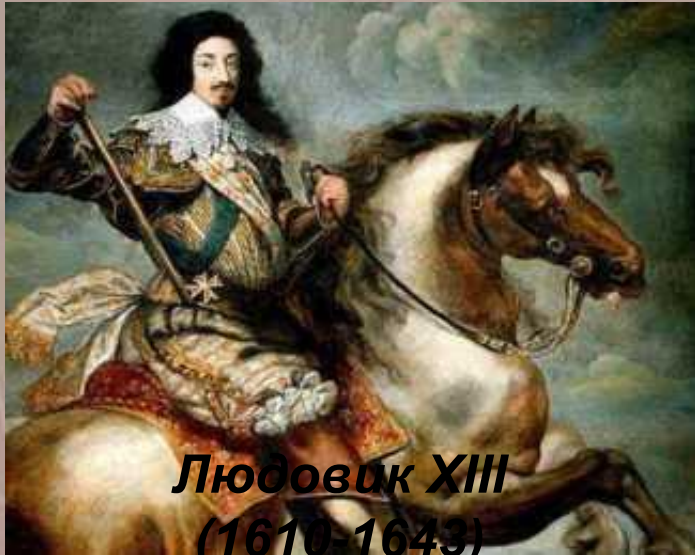
Людовик XIII (1610-1643)

ПРИ ЛЮДОВИКЕ XIII (1610-1643) и КАРДИНАЛЕ РИШЕЛЬЕ