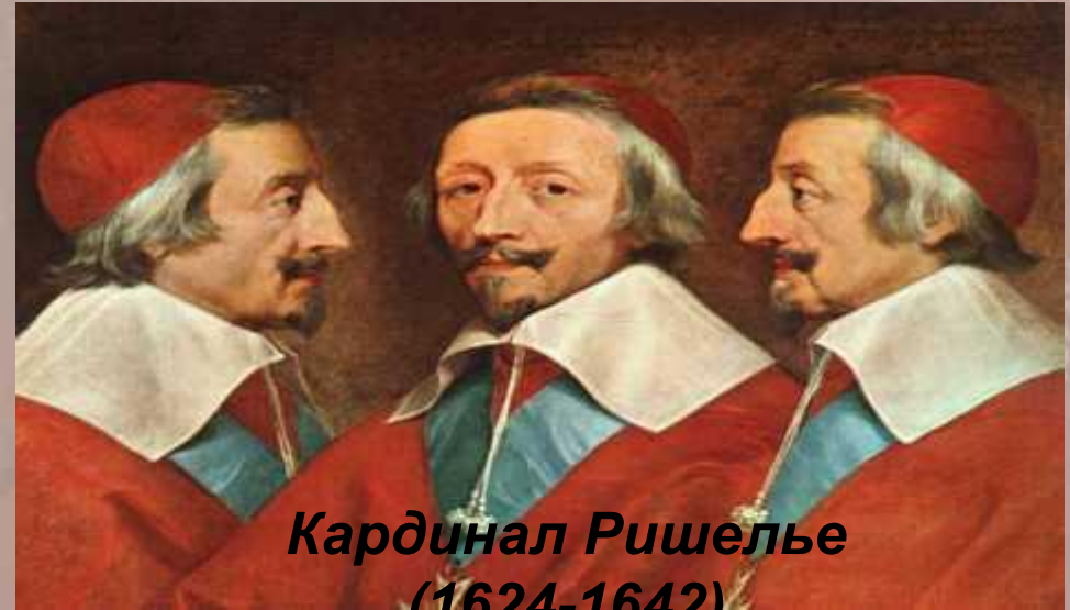
Кардинал Ришелье (1624-1642)