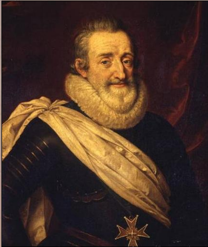
Генрих IV (1594-1610)