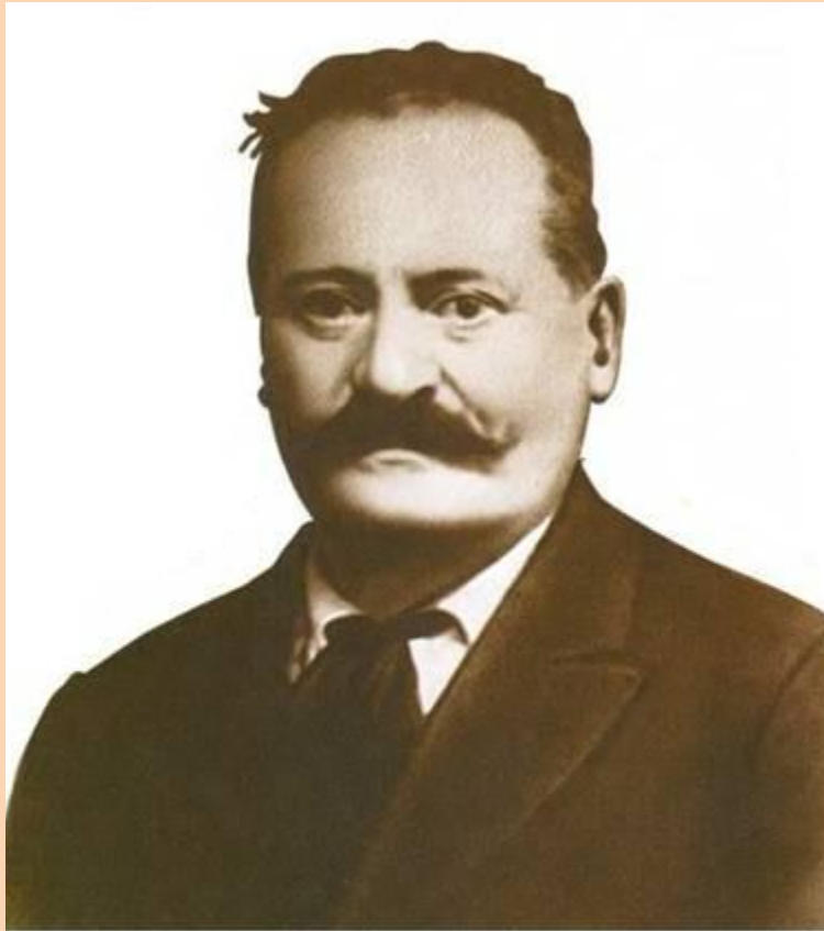
Алессандро Муссолини деревенский кузнец