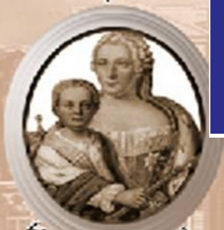
Иван Антонович и Анна Леопольдовна