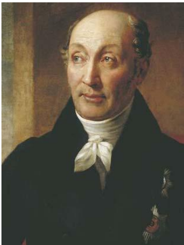
Михаил Михайлович Сперанский (1772-1839), 1808-1811- обер-прокурор Сената