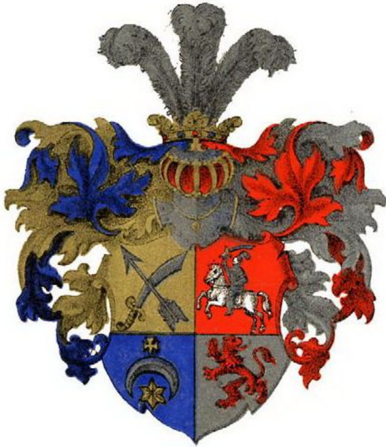
von Tschitscherin. E.

Родовой герб: в первой части обращенный влево красный обернувшийся лев на белом поле, во второй части перекрещенны е стрела и восточная сабля остриями вверх на золотом поле