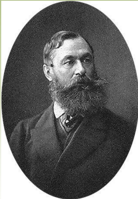
Чичерин Борис Николаевич