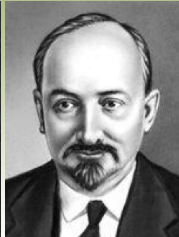
Чичерин Георгий Васильевич