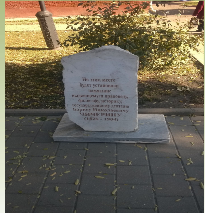
Камень, установленный во дворе Дома-музея Чичериных в Тамбове, извещающий о том, что здесь будет установлен памятник Борису Николаевичу Чичерину