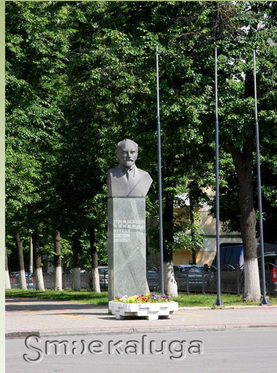
Памятник Георгию Васильевичу в Калуге