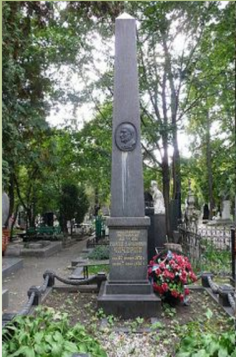
Памятник Георгию Васильевичу на Новодевичьем кладбище